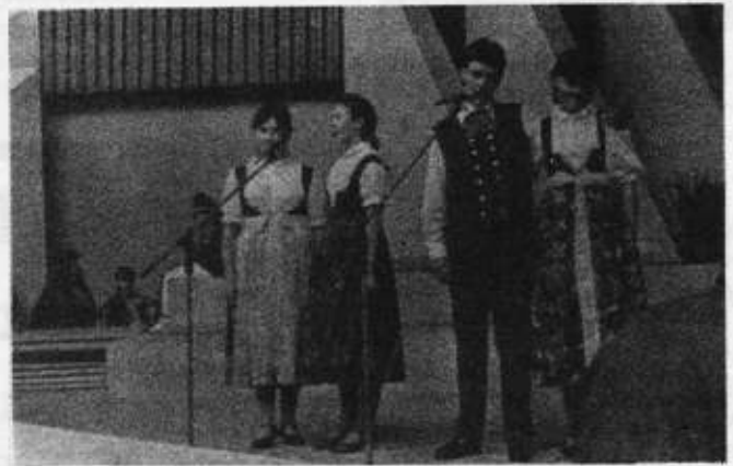
Fragment występu „Estrady Poetyckiej”

Ustron, ul. 1 Maja 62 tel. 33-65 tlx 038432