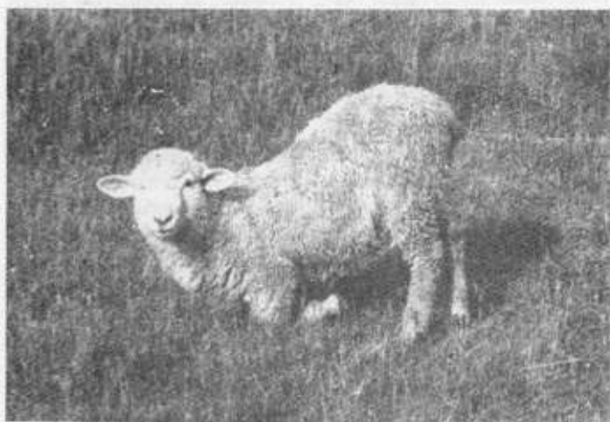
Jagusia — piękność z harymu Jónka na Kypie