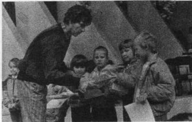
Wręczenie nagród zwycięzcom „Biegu Przedszkolaków”

3 czerwca, w amfiteatrze odbył się trzygodzinny koncert z udziałem ponad 150 wykonawców. Zaprezentowany został doprawdy ciekawy i ambitny program. Było to zarazem podsumowanie dorobku artystycznego zespołów szkolnych.