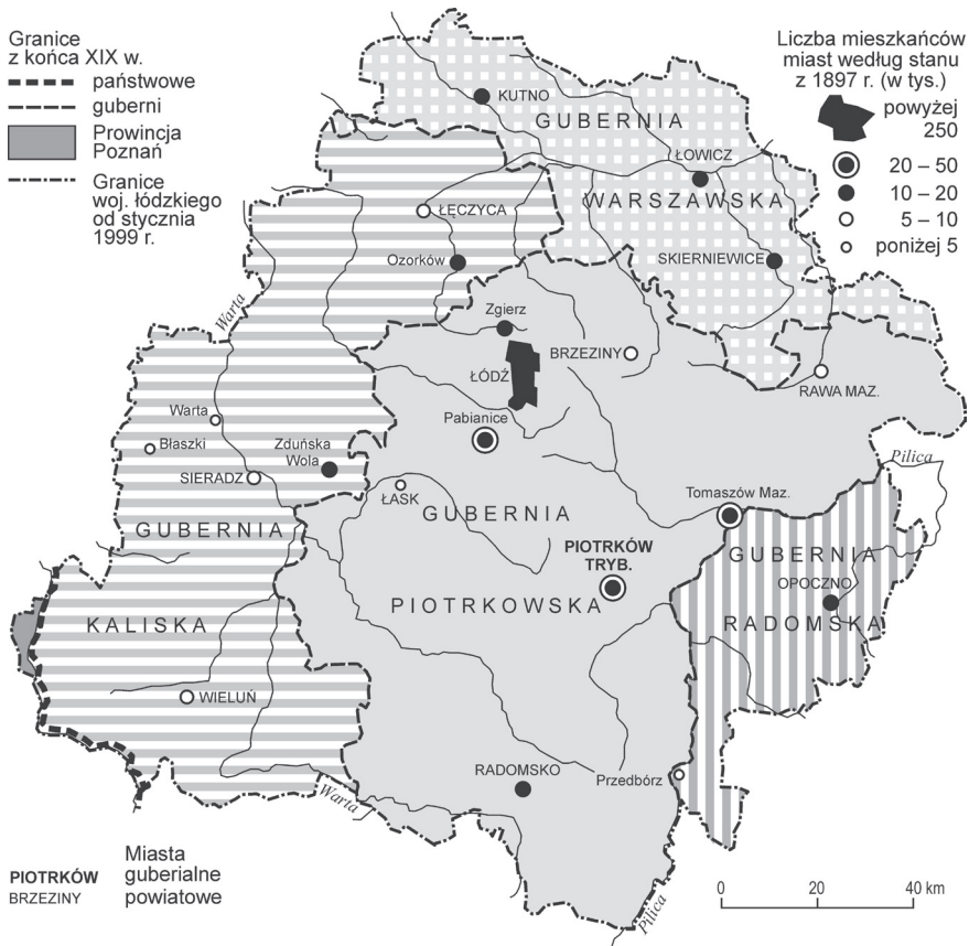
Ryc. 4. Obszar obecnego województwa łódzkiego w rosyjskim podziale gubernialnym po 1867 r.

wy dzięki przeprowadzonemu w tym czasie, obok uwłaszczenia chłopów, również uwłaszczeniu mieszczan, w związku z tym przestały formalnie istnieć miasta prywatne. Tym samym powstała możliwość przeprowadzenia takiego podziału na powiaty, aby ich centrami zostały nie tylko dawne miasta rządowe, niekiedy bardzo małe, lecz także większe dawne miasta prywatne. W tym przypadku zyskał Łask, a stracił Szadek.