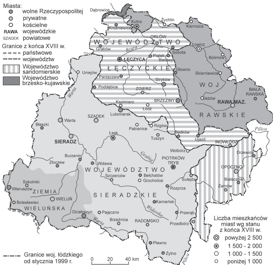
Ryc. 2. Obszar obecnego województwa łódzkiego w podziale administracyjnym Polski w okresie przedrozbiorowym (XIII–XVIII w.)

Po zjednoczeniu Polski przez Łokietka dawne księstwa zamieniono na ziemie. Większe z nich, nad którymi w imieniu króla władał najważniejszy urzędnik ziemski – wojewoda – otrzymały w XIV w. rangę województw. Natomiast mniejsze jednostki terytorialne, nieposiadające urzędu wojewody, nadal nazywano ziemiami. Stosownie do tego dawne księstwa łęczyckie i sieradzkie, po włączeniu ich w połowie XIV w. do Polski, stały się samodzielnymi województwami (ryc. 2).