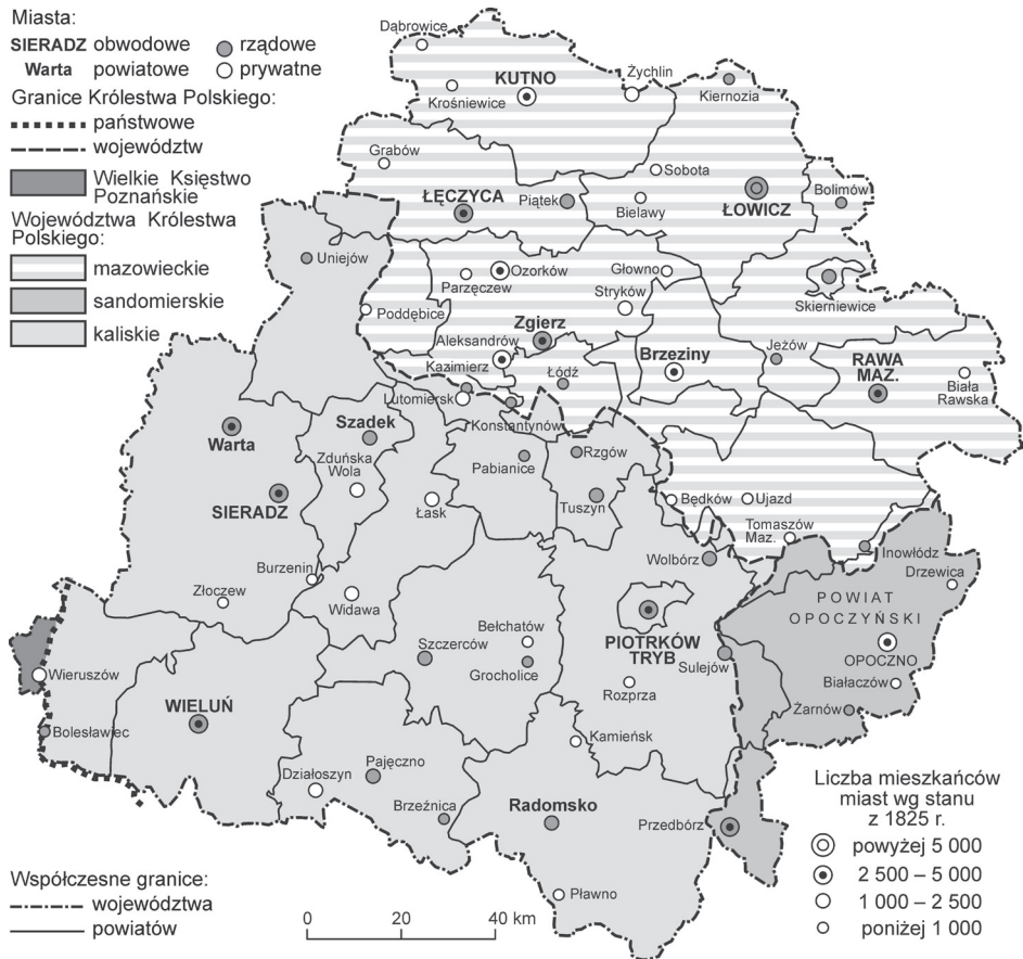
Ryc. 3. Obszar obecnego województwa łódzkiego w podziale administracyjnym Królestwa Polskiego

W kolejnym okresie, po utworzeniu w 1815 r. autonomicznego, w ramach Cesarstwa Rosyjskiego, Królestwa Polskiego, w strukturze administracyjnej ziem obecnego regionu łódzkiego zaszły tylko niewielkie zmiany. Pierwsza, czysto formalna, polegała na przemianowaniu departamentów – mazowieckiego, kaliskiego i radomskiego – ponownie na województwa, bez żadnych wszakże zmian ich granic (ryc. 3). Novum stanowiło natomiast wprowadzenie dwustopniowego podziału ich struktury wewnętrznej. Powołano mianowicie do życia tzw. obwody, łączące w sobie zazwyczaj po dwa powiaty. I tak w województwie mazowieckim utworzono obwód kutnowski z powiatami kutnowskim i gostynińskim, obwód łowicki z powiatami łowickim i sochaczewskim (poza naszym obszarem), łęczycki z powiatami łęczyckim i zgierskim oraz rawski z powiatami rawskim i brzezińskim. W województwie sieradzkim obwód