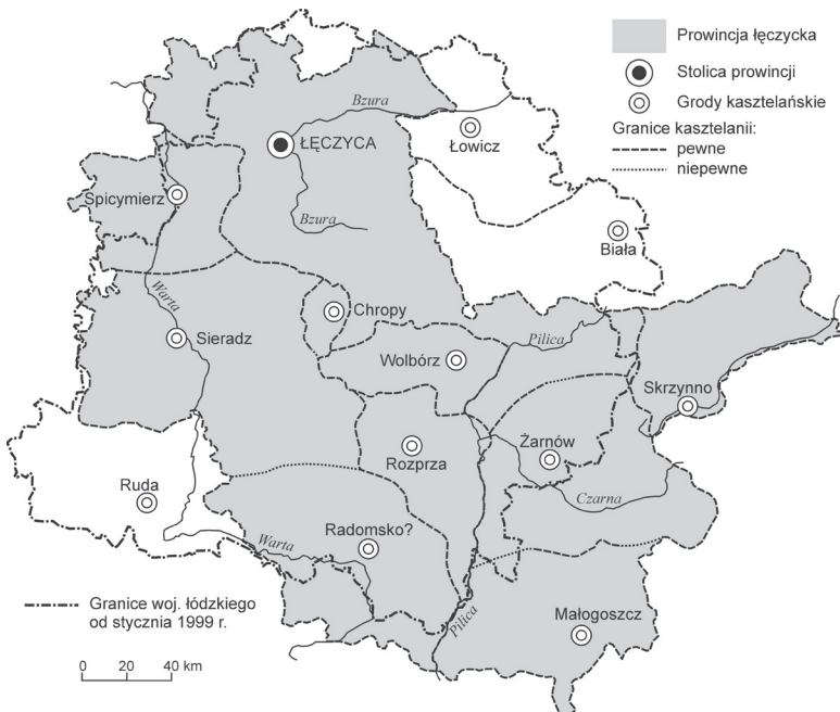
Ryc. 1. Prowincja łęczycka przed okresem rozbitcia dzielnicowego