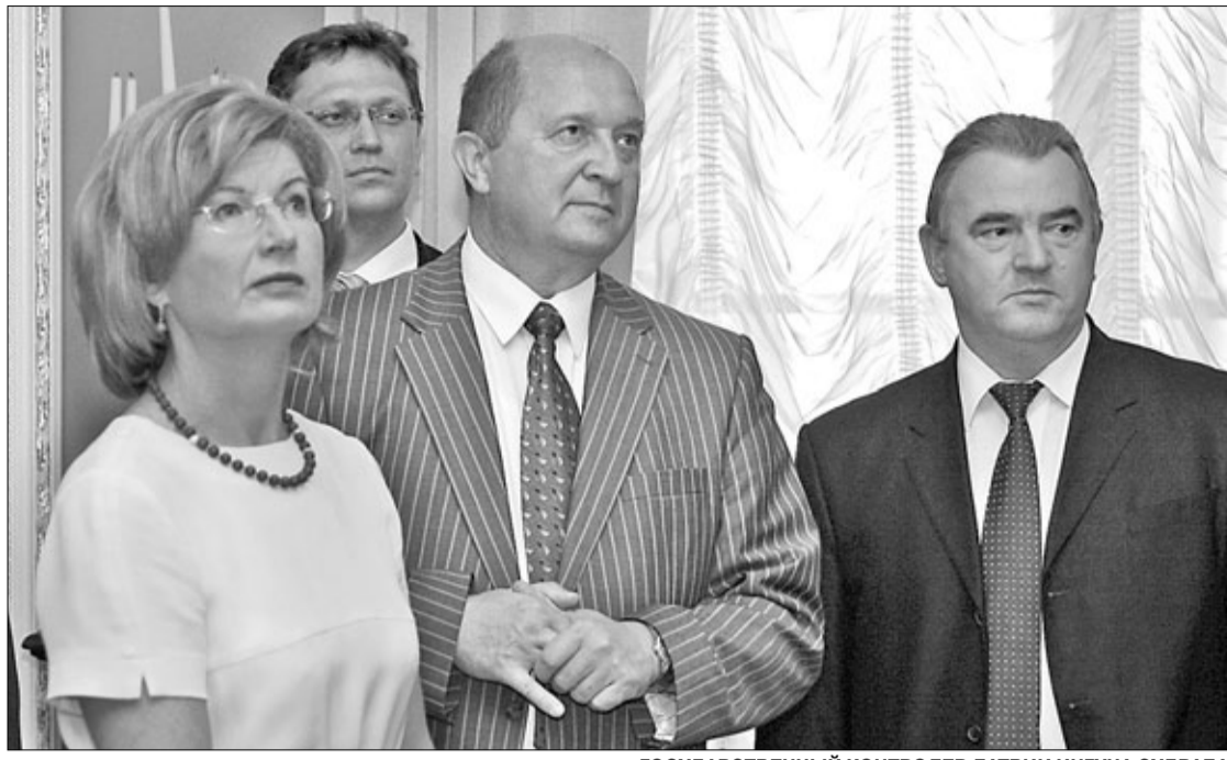
ГОСУДАРСТВЕННЫЙ КОНТРОЛЕР ЛАТВИИ ИНГУНА СУДРАБА, ПРЕДСЕДАТЕЛЬ КОМИТЕТА ГОСКОНТРОЛЯ РЕСПУБЛИКИ БЕЛАРУСЬ АЛЕКСАНДР ЯКОБСОН, ПРЕДСЕДАТЕЛЬ ГОМЕЛЬСКОГО ГОРИСПОЛКОМА ВИКТОР ПИЛИПЕЦ НА ОТКРЫТИИ ВЫСТАВКИ

Решение Гомельского областного Совета депутатов от 26 июля 2011 г. № 119