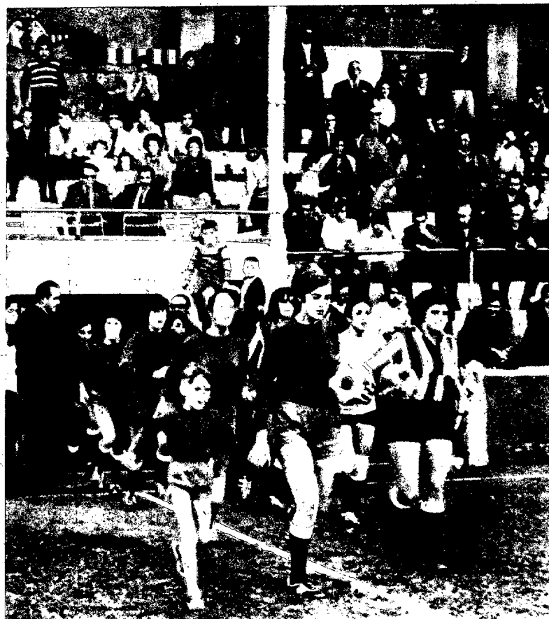
Este es el momento en que los dos equipos participantes saltaron al césped.