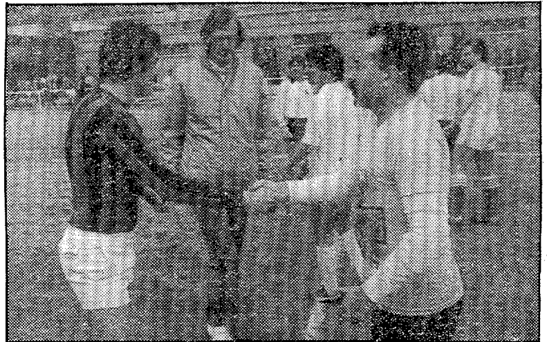
Menotti, de juez, el alcalde Maragall, capitán socialista

Por parte socialista destacaron: el ministro Lluch (destacado en Ma-