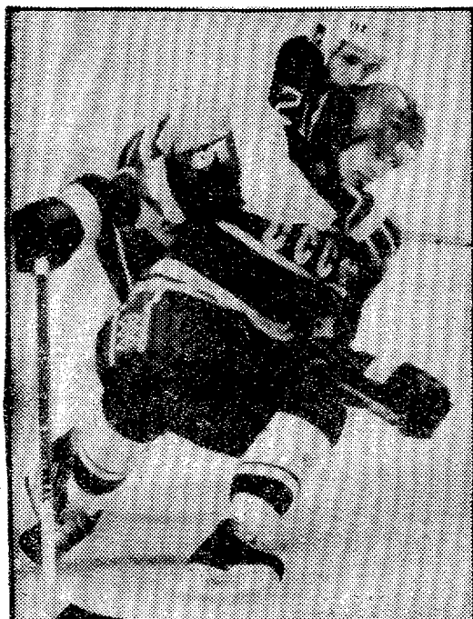
Los jugadores norteamericanos no pudieron evitar la efectividad ofensiva de los soviéticos