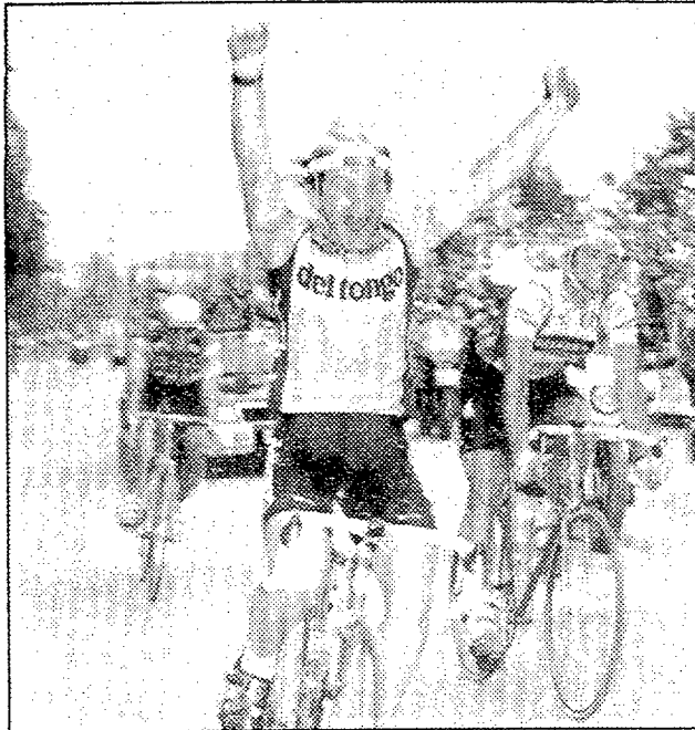
Gelfi estrenó su palmarés en Fabriano

Villanueva, que viajaba con los escapados, pinchó a falta de 5 kms. para meta