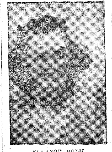
ELEANOR HOLM la que fué dueña de la hegemonía "espaldística" mundial que va caer sucesivamente sus marcas ex-formidables