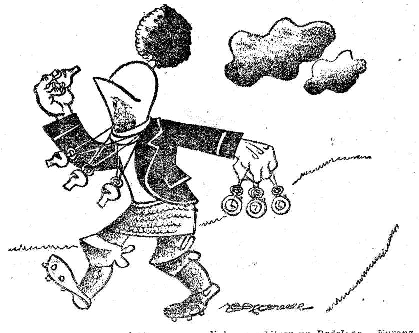
Aquí dentro hay un árbitro que se dirige a arbitrar un Badalona - Europa...

Las competiciones futbolísticas de la Federación Si el Barcelona puede remachar el triunfo en Las Cortes ante el Granollers ...Badalona-Europa tiene la clave del segundo puesto, al que el Júpiter, que recibe a un fácil Sabadell, también aspira :: El Español a Gerona