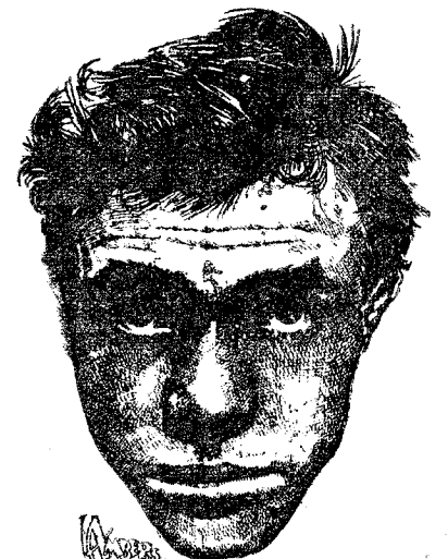
LOU AMBERG, campeón mundial de los ligeros según el Estado de Nueva York... pero segundo según la crítica

Nueva York.—La revista especializada "The Ring" desde tiempo inmemorial publica la clasificación de los boxeadores en orden de mérito, según la opinión de 500 cronistas de pugilato, de acuerdo con sus actividades en el año que termina.