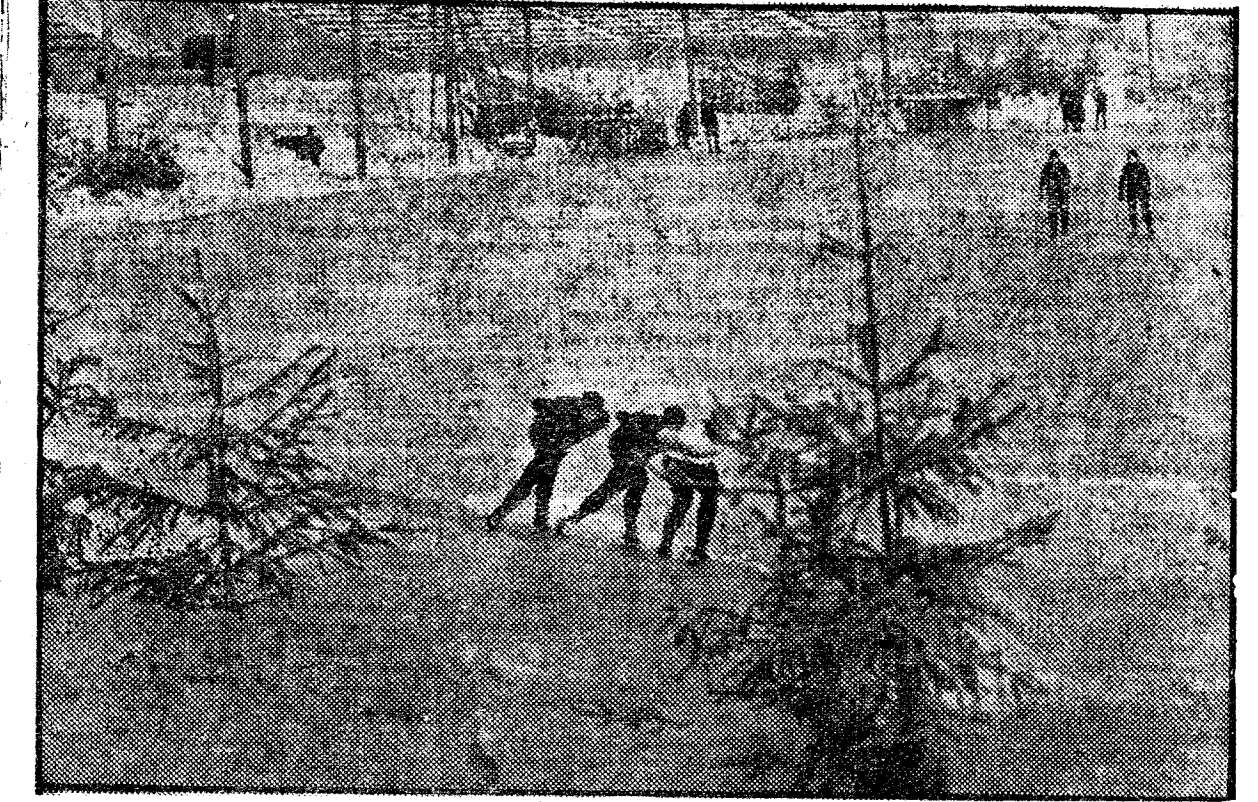
Las formidables instalaciones del Estadio Dynamo de Moscú, en invierno como en verano, acondicionadas para todo y ahora, los deportistas soviéticos pueden dedicarse al patinaje en la pista helada que aquí vemos en una sesión de entrenamiento