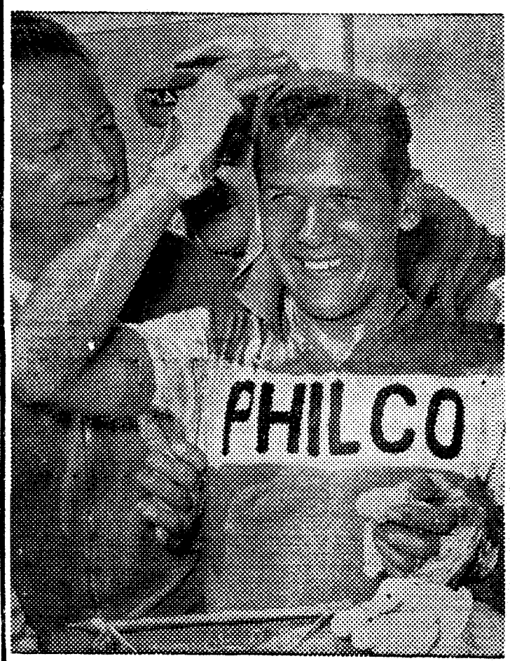
El belga Emile Daems, vencedor de la etapa Pont L'Evêque - Saint Malo, es ayudado a recomponer la figura tras su triunfal llegada a la meta de dicha etapa.