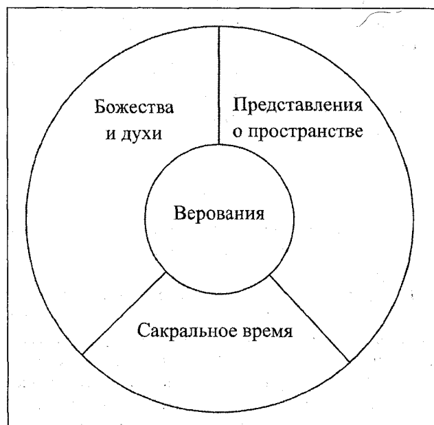
Схема 11. Верования

Также можем представить обобщенные и подробные схемы. Например, схема главы «Божества и духи» (Схема 12).