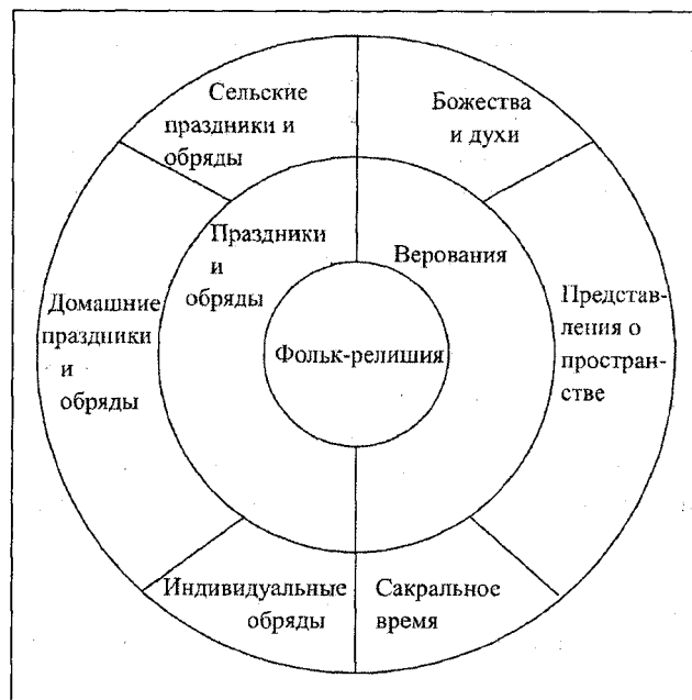
Схема 16. Система фольк-религии

Исследование самобытного и обширного слоя культуры позволило получить гносеологическое представление о фольк-религии чувашей. Расшифровку схем и таблицы-вкладыша читатель может проделать самостоятельно. Ценно то, что все элементы и блоки фольк-религии состоят в сложных обусловленных связях и состав-