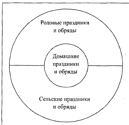
Схема 2. Система домашних праздников и обрядов (верхние уровни)

Результат анализа материалов по индивидуальной обрядности также можно представить в схеме (Схеме 3).