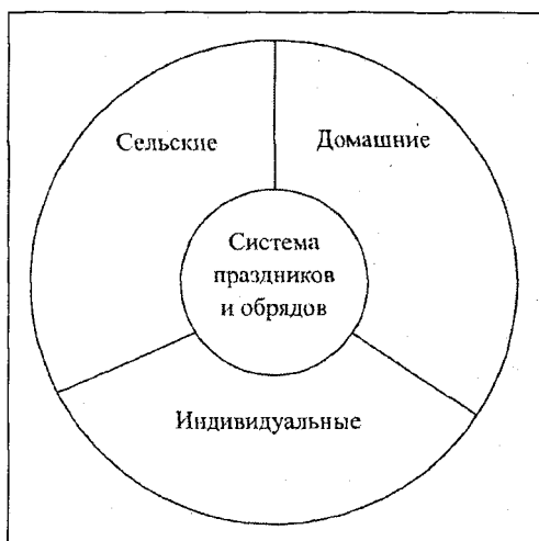
Схема 1. Система сельских праздников и обрядов (верхние уровни)

Домашние праздники и обряды обобщенно можно представить на следующей схеме (Схема 2).