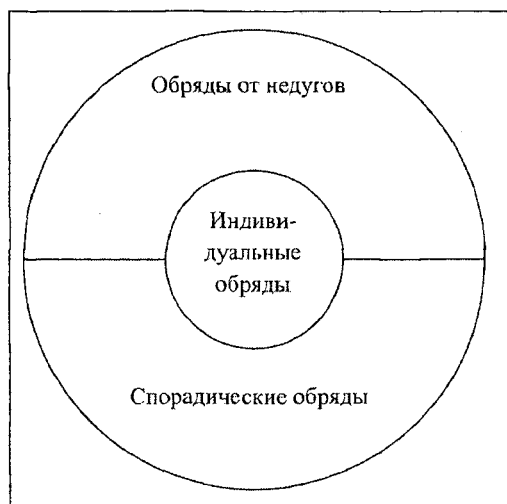
Схема 3. Система индивидуальной обрядности (фрагмент верхних уровней)

Систему праздников и обрядов в целом можно отобразить в схеме 4.