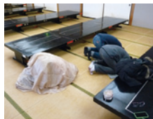
様々な場所で礼拝をすることができます

清潔で静かな場所であれば、土間でも屋外でも、どのようなスペースでも礼拝は可能です。