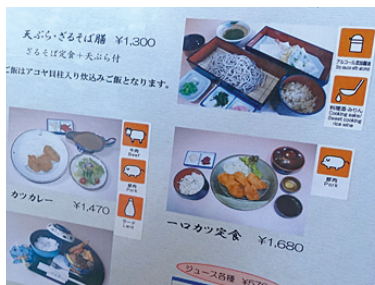
メニュー表に原材料を表示