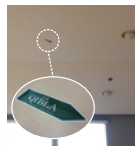
天井にキブラを貼付