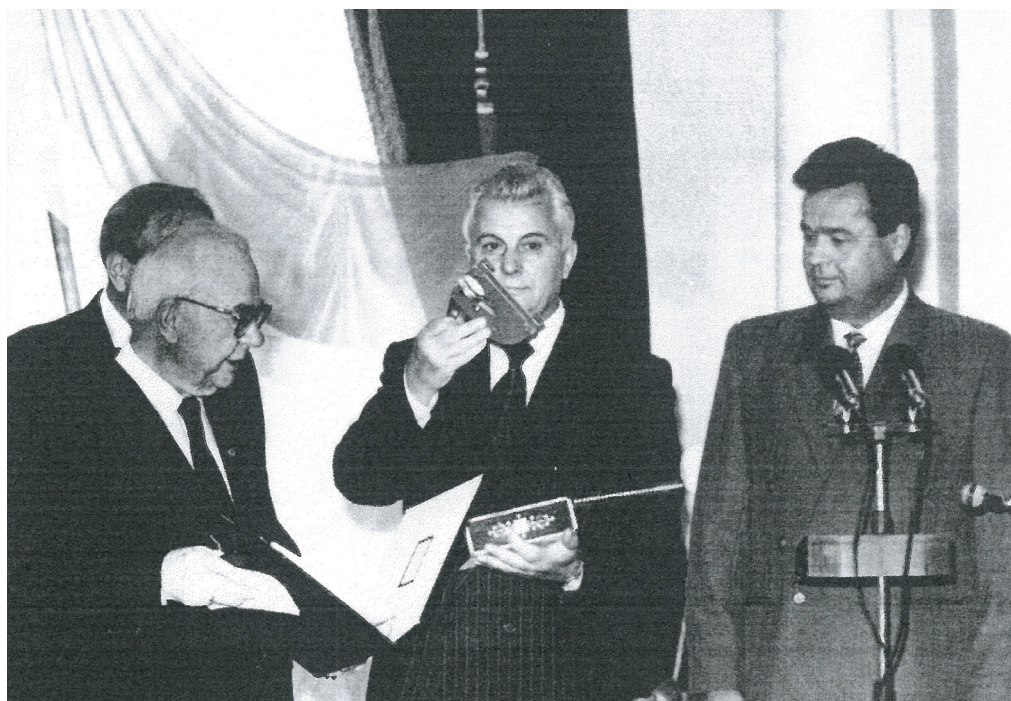
Передавання атрибутів державного екзильного Уряду УНР першому Президентові України Леоніду Кравчуку. 24 серпня 1992 року, Київ. На фото крайній зліва – І.М. Самійленко, у центрі – перший Президент України Леонід Кравчук, крайній справа – Голова Верховної Ради І.С. Плющ

А 24 серпня, в день відзначення першої річниці відновлення незалежності України (саме відновлення, а не проголошення. – авт. ) в Маріїнському палаці в Києві Л.М. Кравчук під час одержання символів і регалій УНР та її Державного Центру наголосив: «Цей акт повинен нагадати всім, що Україна веде свій родовід, свою політичну, державницьку біографію від історичних часів, які надають силу і велич нашому народові, – від часів Київської Русі, Козацько-Гетьманської держави й Української Народної Республіки».