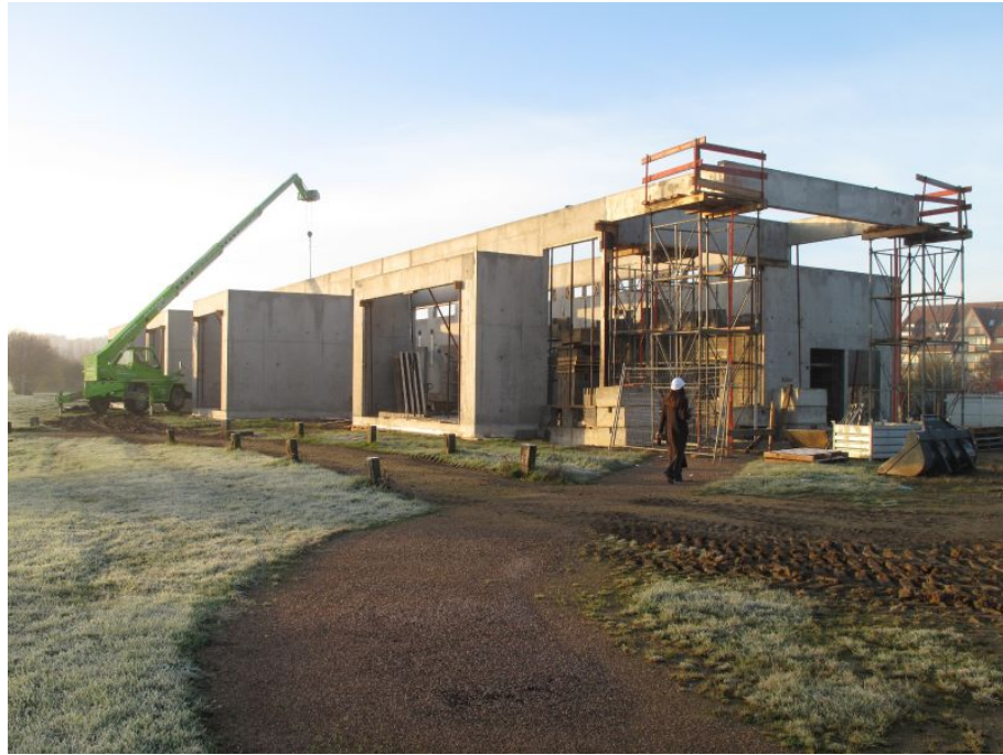
Bâtiment du Paléospace en construction