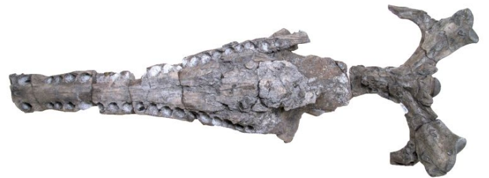
Crâne de Métriorhynchus