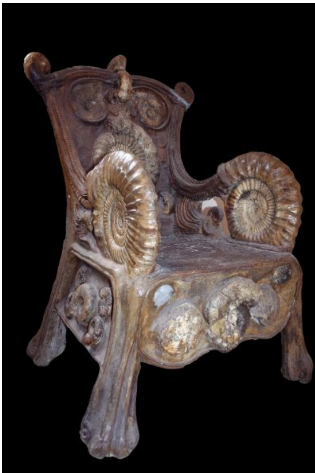
Fauteuil de Postel