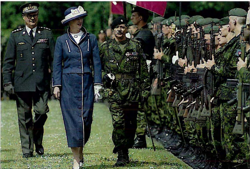
Hendes Majestæt Dronningen og Hans Kongelige Højhed Prins Henrik skridter fronten af ved paraden for oprettelsen af Den Danske Internationale Brigade.

Næppe nogen anden forsvarspolitisk beslutning har i nyere tid påkaldt sig så stor offentlig opmærksomhed og vakt større international genklang. Danmark har som et af de første lande taget en direkte konsekvens af den ændrede sikkerhedspolitiske situation og opstillet en enhed på 4.500 menige, befalingsmænd og officerer, som kan stilles til rådighed for international tjeneste.