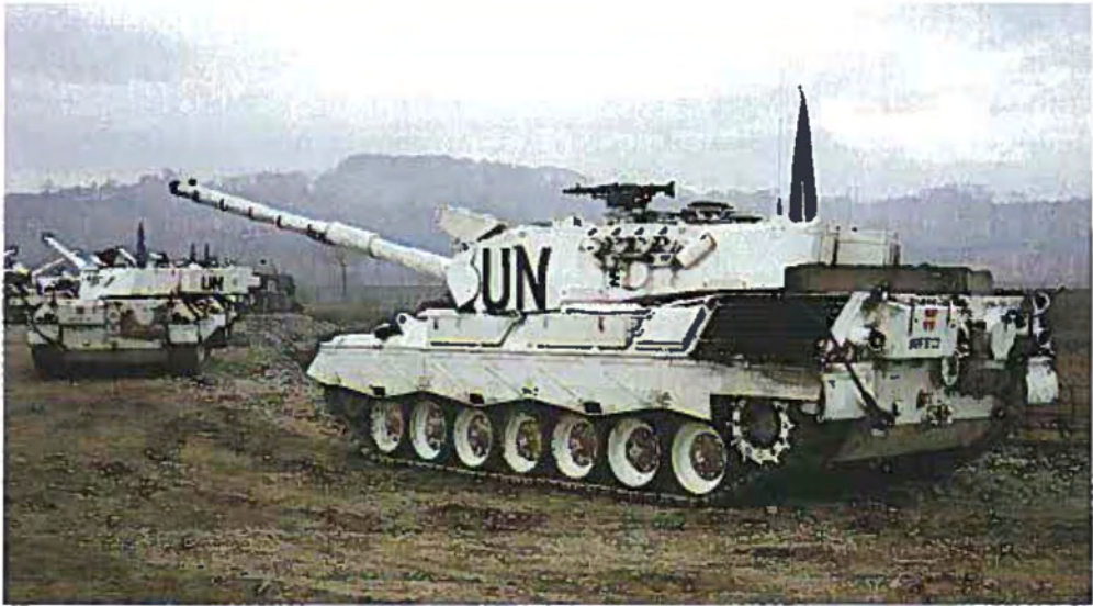
Danske LEOPARD-kampvogne efter ankomsten til Tuzla i Bosnien-Hercegovina.

29. marts: Danmark afgiver bekræftet tilsagn om at kunne stille stabs-officerer og et hovedkvarterkompagni fra Den Danske Internationale Brigade til rådighed for FNs beredskabsstyrke (UN Stand-By Forces) fra den 1. januar 1995.