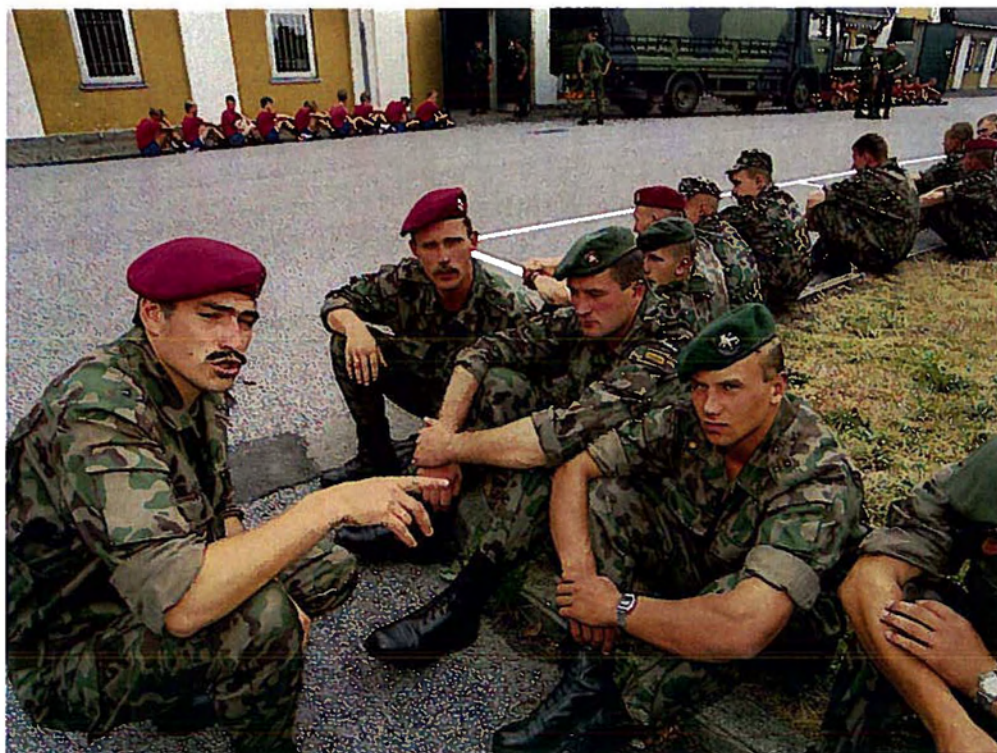
Den litauiske deling, LITPLA var forinden udsendelse til DANBAT under uddannelse hos bl.a. Sjællandske Livregiment. Her ventes på vaccinationer.

Forud for udsendelsen af den litauiske deling LITPLA havde en enhed fra Bornholms Værn aflagt to ugers besøg i Litauen for at gennemføre øvelser i fredsbevarende teknikker mv. med de 32 litauiske soldater. Derefter fulgte to ugers træning ved det kompagni ved Sjællandske Livregiment, som delingen skulle indgå i.