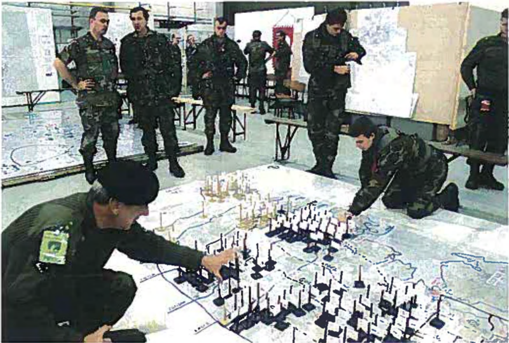
Fra BALTAPs hovedkvarter under øvelse CHINESE EYE.

skyde- og øvelsesterræn og skabe mulighed for at bevare og genskabe de naturmæssige værdier.