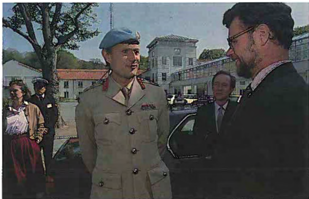
Chefen for FNs styrker i Bosnien-Hercegovina, generalløjtnant, sir Michael Rose modtages af forsvarsminister Hans Hækkerup ved Nordisk Forsvarsministermøde i Korsør.

6. maj: Som et led i Danmarks rolle som koordinerende for Det Nordatlantiske Samarbejdsråds (NACC) arbejde med at standardisere niveauet af uddannelsen til fredsbevarende operationer distribueres en håndbog over kurser i NACC-landene.