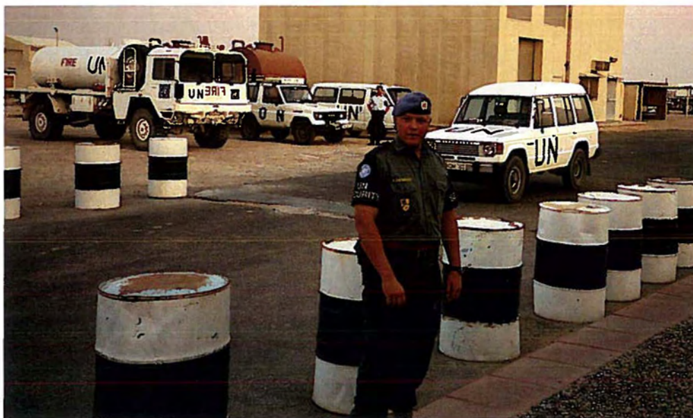
Dansk FN-soldat på arbejde ved UNIKOM i Kuwait.