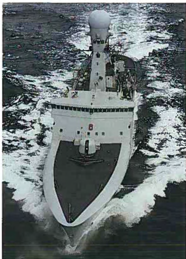
Inspektionsskibene af THETIS-klassen omfatter THETIS, TRITON, VÆDDEREN og her HVIDBJØRNEN.

26. august – 11. september: Som led i forsvarets samarbejde med den danske forsvarsmaterielindustri – repræsenteret ved eksportklubben »Naval Team (Denmark)« – aflægger inspektionsskibet VÆDDEREN flådebesøg i Sydafrika. Besøget indgår som et led i et dansk eksportfremstød under ledelse af Industri- og Samordningsministeren.