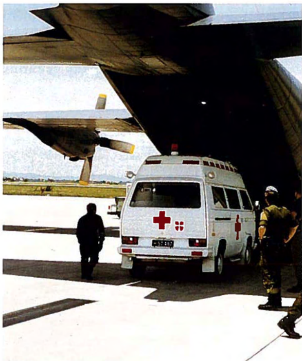
Dansk ambulance kører ombord i et af flyvevåbnets C-130 Hercules-fly for at hente en såret dansk FN-soldat i ex-Jugoslavien.

samt fremsætte forslag til en eventuel ændret placering af Hærens Flyvetjeneste.