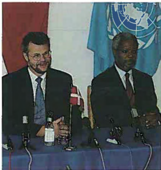
FNs vicegeneralsekretær for fredsbevarende operationer, Kofi Annan sammen med forsvarsminister Hans Hækkerup under pressemødet ved oprettelsen af brigaden.

rade på Vordingborg Kaserne. Hendes Majestæt Dronningen, Vicegeneralsekretæren for FNs fredsbevarende operationer, Hr. Kofi Annan, Forsvarsministeren og repræsentanter for forsvaret deltager i ceremonien. Fra samme dato nedlægges 2. Sjællandske Brigade.