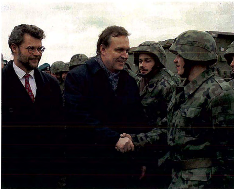
Tysklands forsvarsminister Volker Rühe og forsvarsminister Hans Hækkerup hilser på de polske soldater, der deltog i øvelse CARBON GAP.

I årets løb blev der indgået to operative aftaler om fly- og søredning, som for begge aftalers vedkommende medførte udvekslingsbesøg og øvelsesvirksomhed. Der blev gennemført en række gensidige flådebesøg, og der blev afholdt en fælles dansk-tysk-polsk minestrygningsøvelse BALTIC ENDEAVOUR i Mecklenborg Bugt og Østersøen. Fra dansk side deltog en STANDARD-FLEX udrustet som minejager i øvelsen, medens Polen og Tyskland hver deltog med 2 minestrygere.