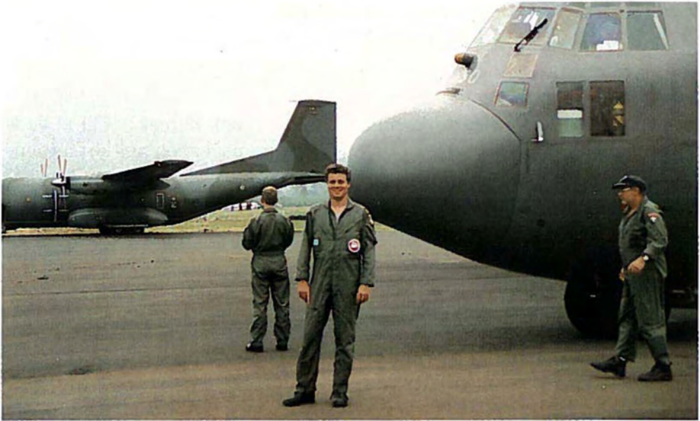
Til højre flyvevåbnets C-130 Hercules-fly i Rwanda.

get i Sikkerhedsrådet, til en mission er udsendt og på plads. Med den ny beredskabsstyrke vil de første enheder kunne være på plads på omkring 14 dage. Efter 4-6 måneder i området forudsættes andre enheder at komme til og afløse Stand-By Force enhederne, der herefter trækkes hjem igen og gøres klar til at kunne blive udsendt på ny.