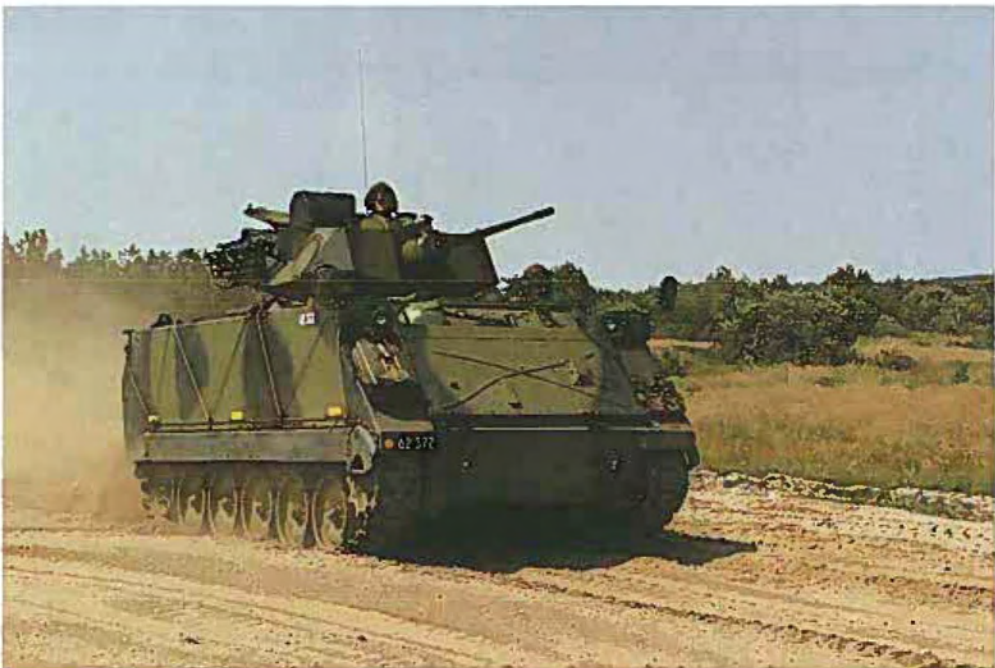
Hærens nye pansrede maskinkanon M/92.

Pansret mandskabvogn med påmonteret maskinkanon (pansret maskinkanon M/92) udleveres til de første uddannelsesenheder. Den pansrede maskinkanon giver en forbedring af panserinfanterikompagniernes ildkraft i dagslys og i mørke.