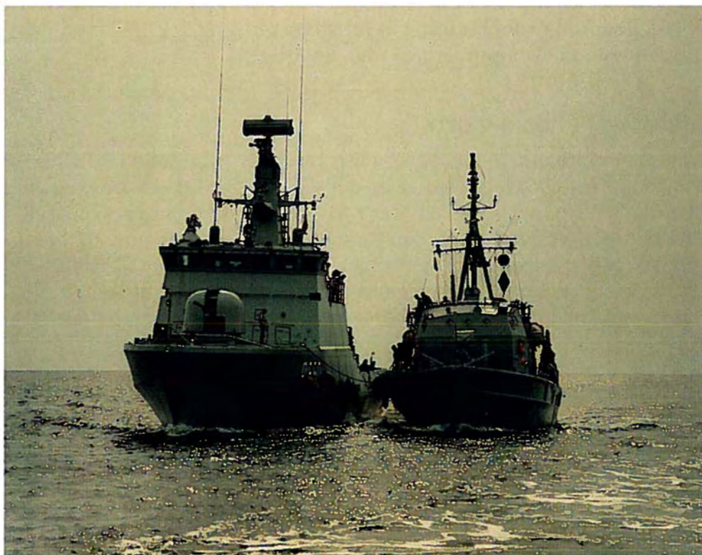
Overførsel af mandskab mellem den tyske minestryger FRAUENLOB og danske FLYVEFISKEN under øvelse BALTIC ENDEVOUR.

For søværnet videreførtes STANDARD FLEX 300-programmet i 1994 med bygning af seriens 14. skib. Fartøjet forventes taget i operativ drift i 1996. Opbygningen af et civilt orienteret oceanografi- og miljøkontrolmodul samt et forureningsbekæmpelsesmodul blev også fortsat i 1994. Finansudvalget godkendte i 1994 anskaffelse af materiel for ca. 191 mio. kr. til færdiggørelse af STANDARD FLEX 300-enhederne nummer 13 og 14. Anskaffelsen, der omfatter skibs- og elektronikudrustning, skal