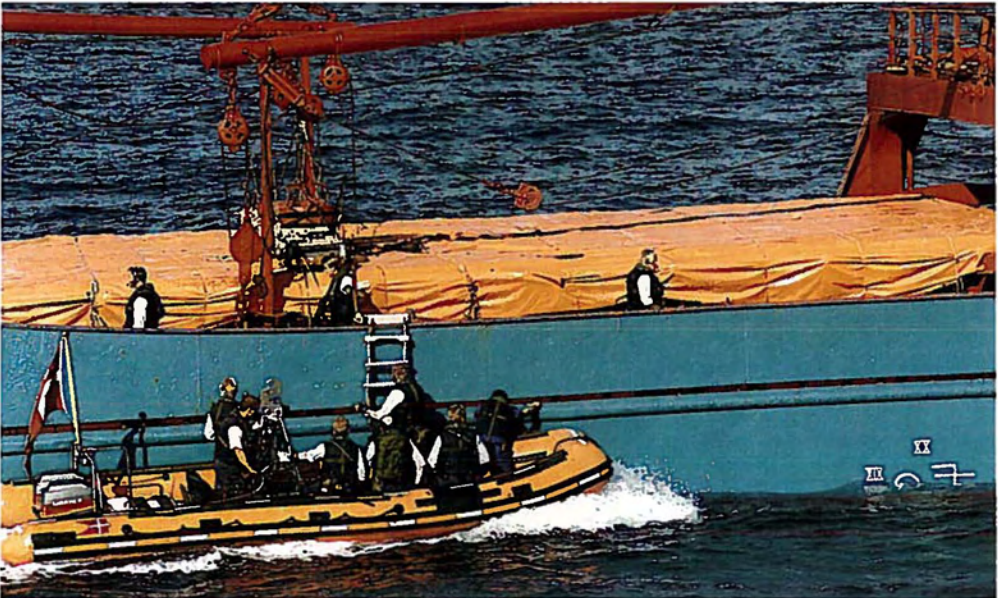
Dansk boarding-hold fra korvetten OLFERT FISCHER på arbejde i Adriaterhavet under operation SHARP GUARD.

Folketinget gav enstemmigt med Folketingsbeslutning B 84 af 12. april 1994 sit samtykke til, at Danmark også i 1994 kunne bidrage med en korvet til opretholdelsen af den maritime embargo af det tidligere Jugoslavien, operation »SHARP GUARD«. Folketinget gav også sit samtykke til, at Danmark kunne bidrage til operationen fremover, så længe embargoen måtte blive opretholdt.