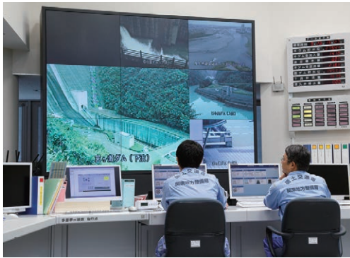
ダムの様子はこのマルチモニターで確認。放流の際のダム操作もこの部屋で行う。

宮ヶ瀬ダムには、きれいで適温の水を流すための選択取水設備、利水放流設備の他に、洪水時にダムに貯まった水を安全な水量だけ下流に放流する目的で設けられた高位常用洪水吐設備、低位常用洪水吐設備といった複数の放流設備