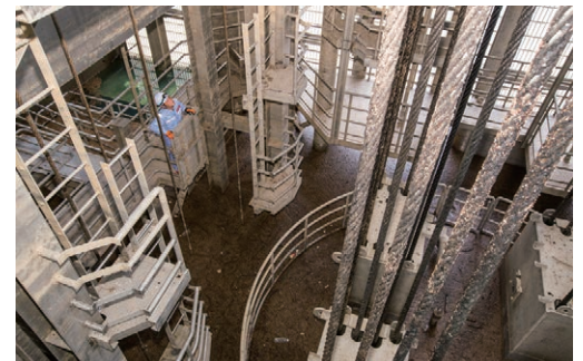
選択取水設備の内部を点検。通常時はこの設備から取り込んだ水が放流管を通り下流に流されている。

前提の職場で、自分の後任者が滞りなく安全にダム管理が行えるよう準備しておくことも、重要な業務の一つだといえるでしょう。