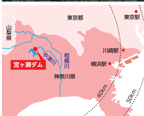
宮ヶ瀬ダムの位置