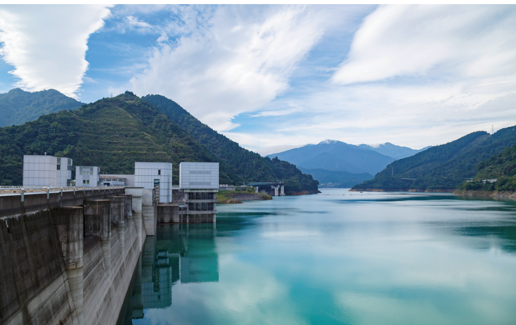
宮ヶ瀬ダムの貯水池「宮ヶ瀬湖」。総貯水容量の約2億 m 3 は箱根の芦ノ湖とほぼ同じ。「神奈川県の水がめ」とも呼ばれている。

宮ヶ瀬ダムの最新情報が掲載されているホームページはこちら http://www.ktr.mlit.go.jp/sagami/sagami_index015.html