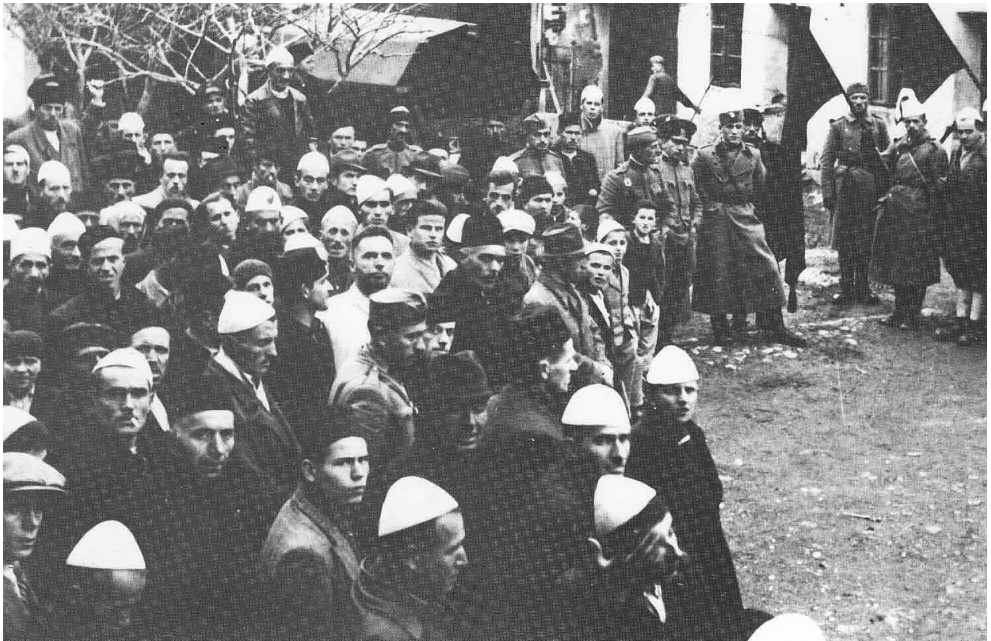
Освећење ратне заставе уочи напада албанских оружаних формација на припаднике српског народа на Косову и Метохији