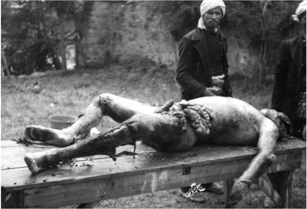
Српска жртва албанског терора на Косову