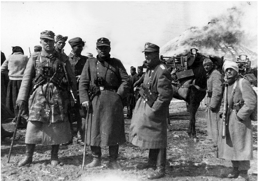
Немци и Албанци пале српска села