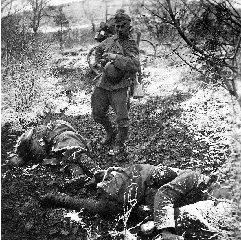
Терор Албанаца над припадницима Војске Краљевине Југославије у Априлском рату 1941. године на Косову и Метохији