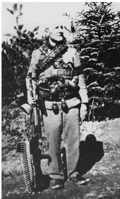
Припадници балистичких формација