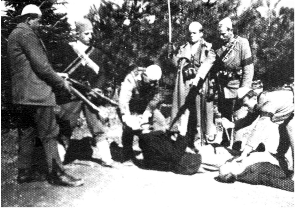
Албански злочинци изнад тела убијених Срба