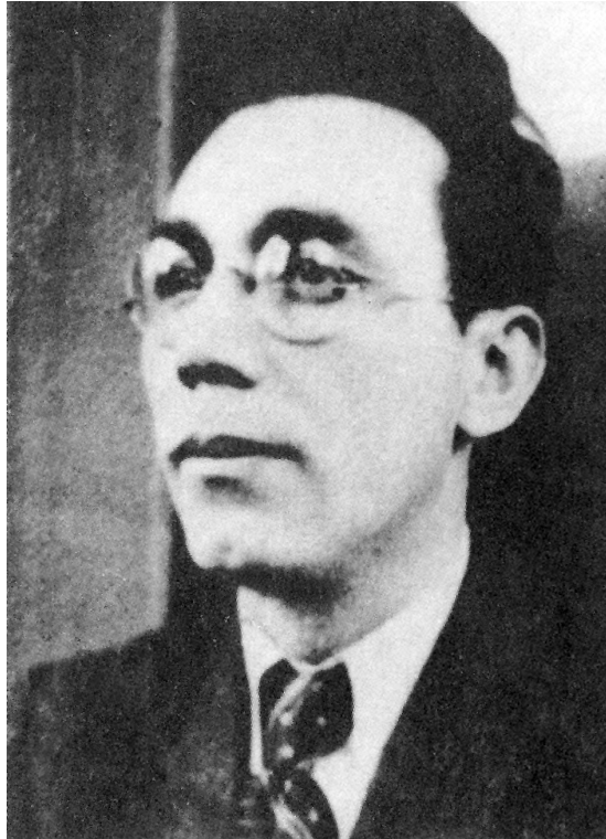
Џафер Дева, руководилац Албанског народног савеза и дугогодишњи сарадник немачке обавештајне службе