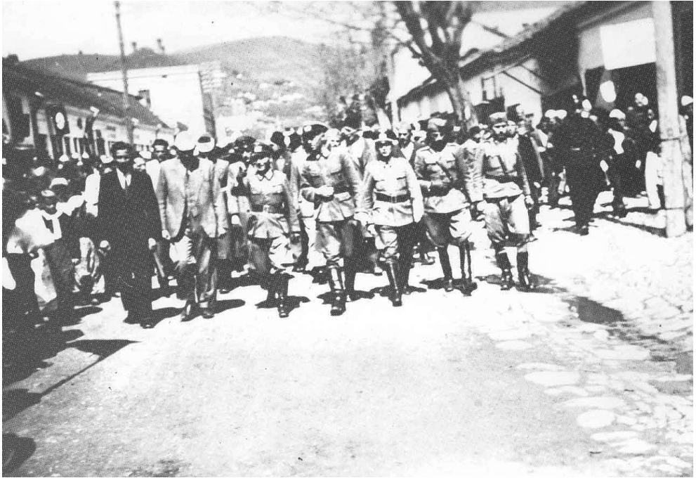
Албанско фашистичко вођство дочекује немачке војне представнике у Новом Пазару