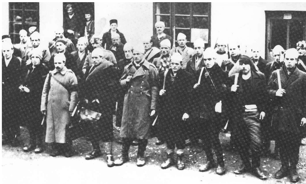
Припадници албанске 21. СС дивизије „Скендербег“