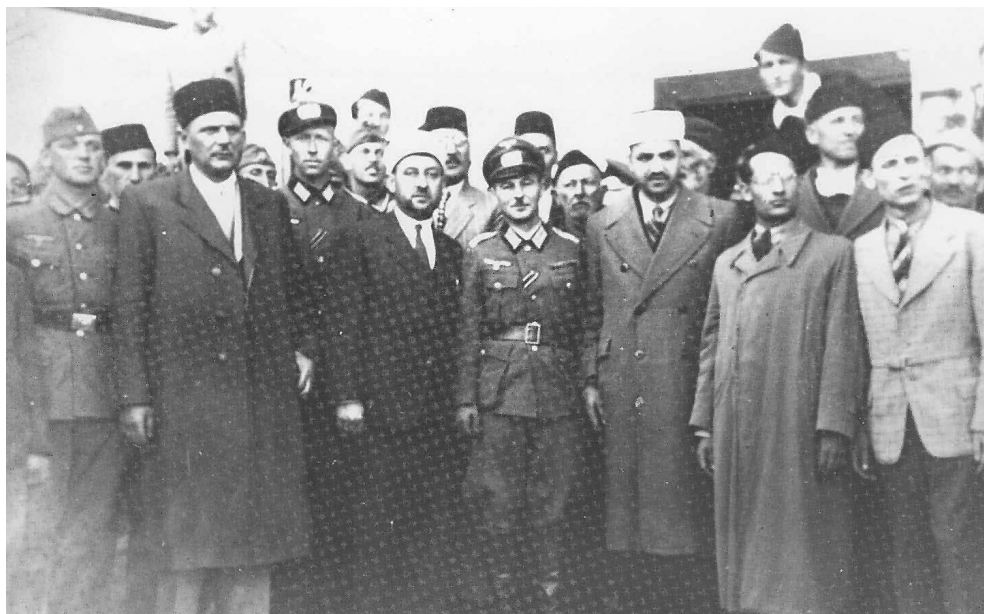
Просветни и верски представници Албанаца после заједничког састанка с немачким нацистима