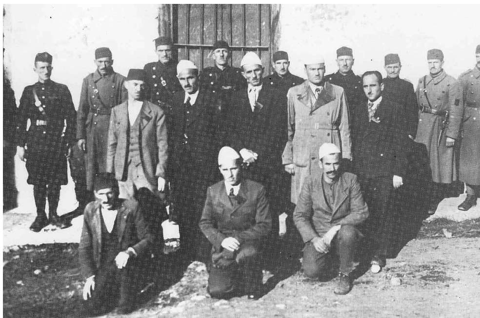
Политички штаб Косовског комитета, једне од најзначајнијих албанских политичких организација, која се залагала за одвајање Косова од Краљевине Југославије и стварање „Велике Албаније“