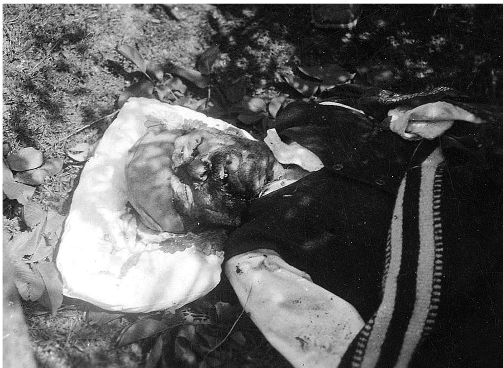
Злочини Албанаца на Косову