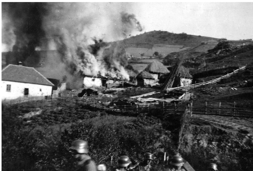
Злочини Немаца и балиста на Косову и Метохији – паљење села Борчане код Косовске Митровице