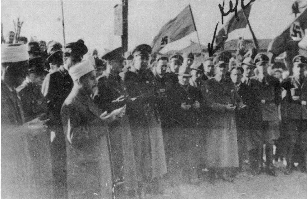
Молитва за победу немачког оружја, август 1942, Косовска Митровица