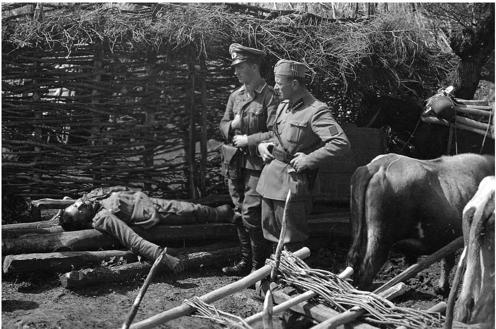
Немачки и италијански официри посматрају један од многобројних злочина албанских оружаних формација на Косову над Србима