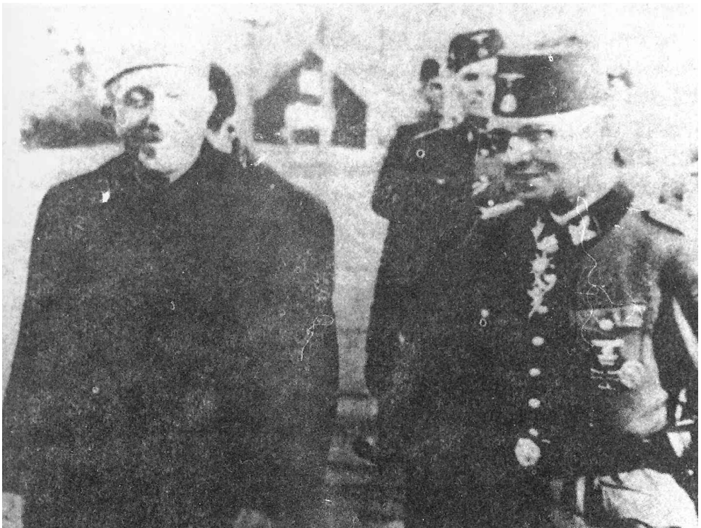
Јерусалимски муфтија Мухамед ел Хусеини врши смотру СС дивизије „Ханџар“