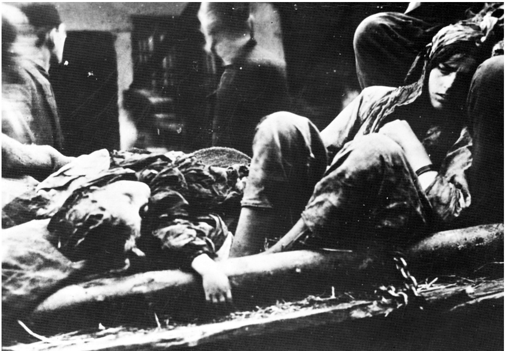
Албанци су за време окупације на Косову и Метохији масакрирали и српску децу