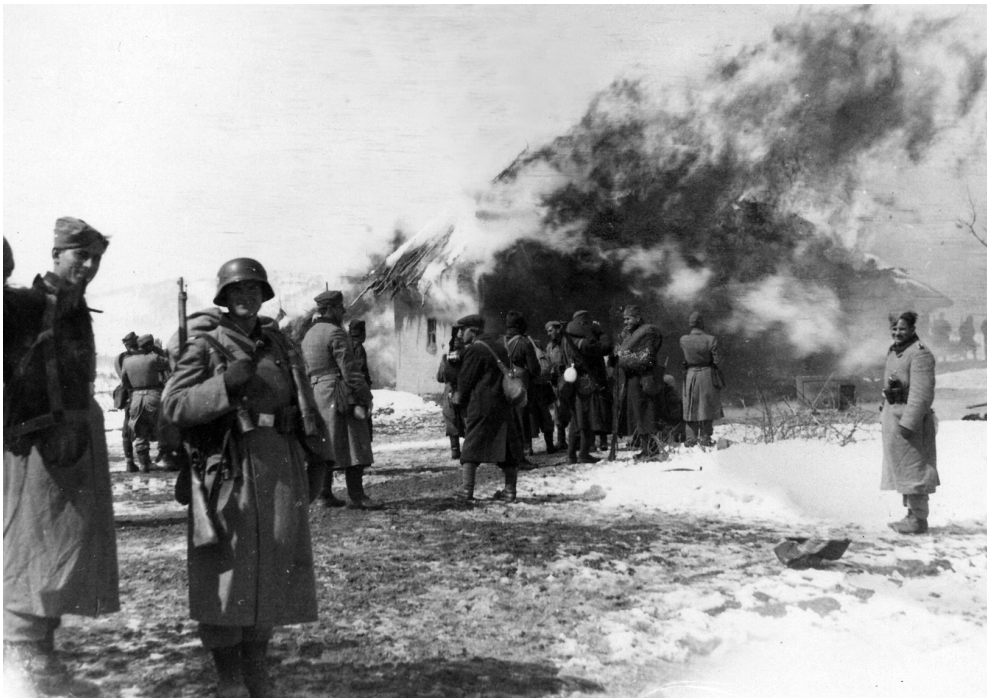
Немци и Албанци пале српска села