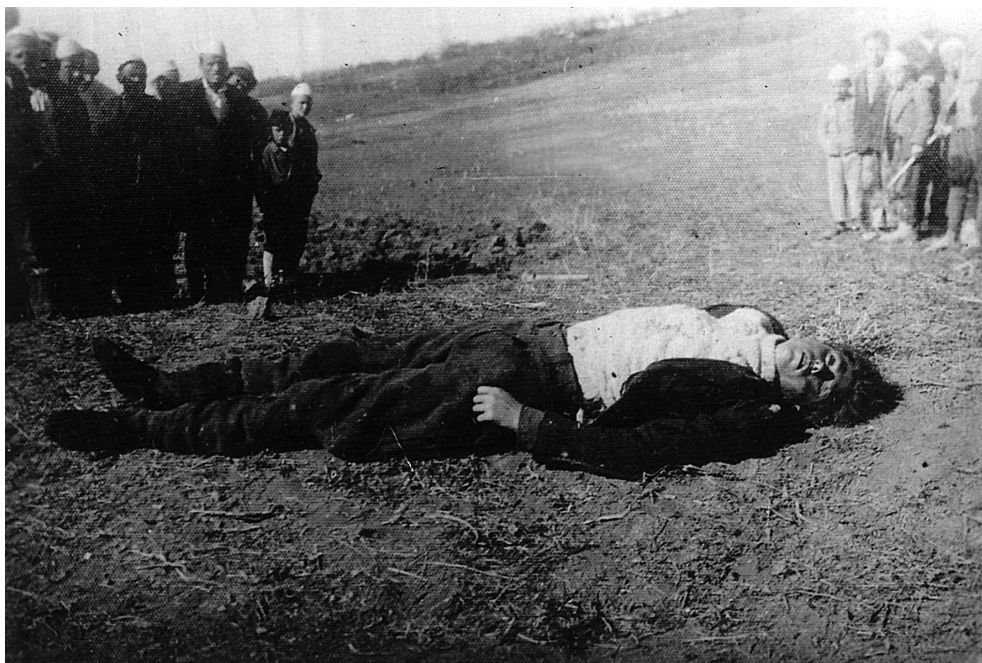
Албанско становништво окупљено око тела убијеног Србина