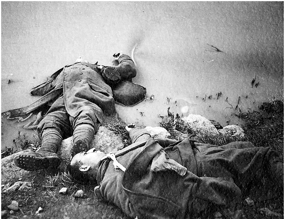
Терор Албанаца над припадницима Војске Краљевине Југославије у Априлском рату 1941. године на Косову и Метохији