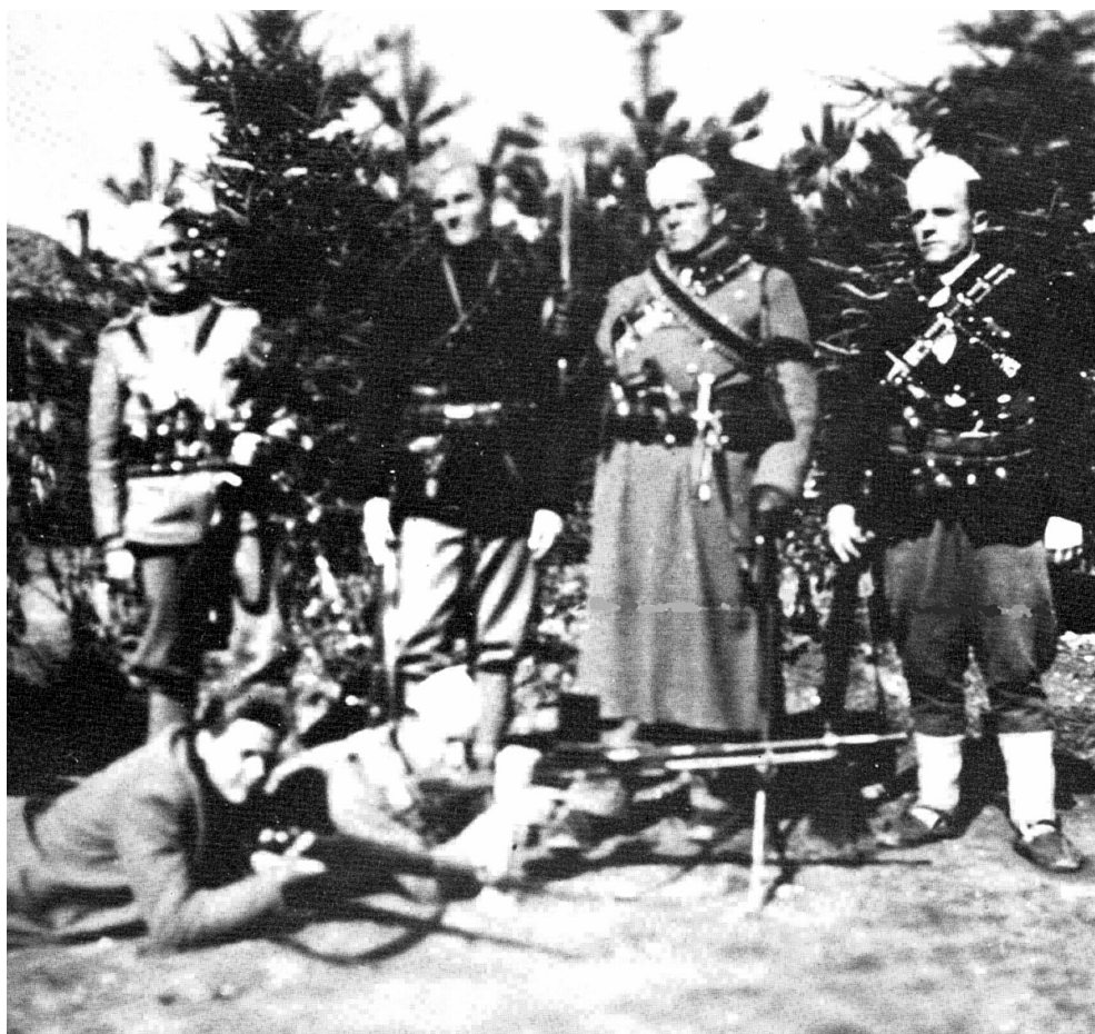
Припадници албанских оружаних формација