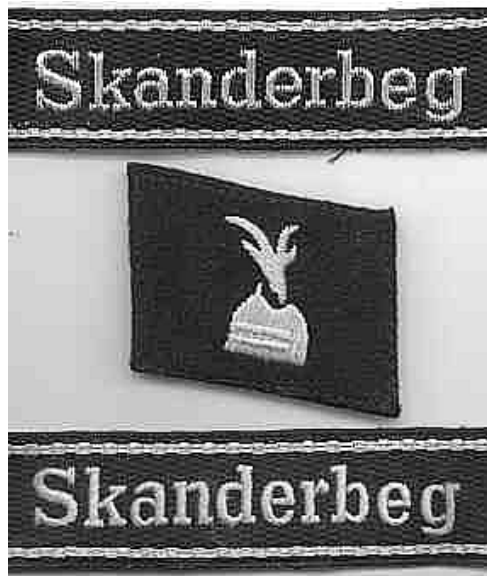
Обележје 21. СС дивизије „Скендербег“