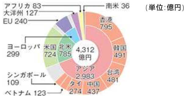
日本の農林水産物・食品の輸出先国の分布 (2008 年)