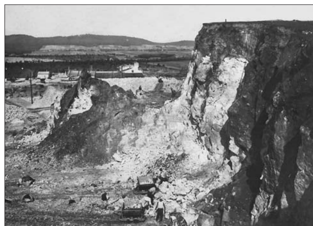
Ryc. 5. Ściana kamieniołomu Sitkówka z lejem krasowym, w którym znaleziono kopalne kości. Fot. J. Czarnocki, 1948

Fig. 5. The face of the Sitkówka quarry with a karst paleodoline, in which fossil bones were found. Photo by J. Czarnocki, 1948