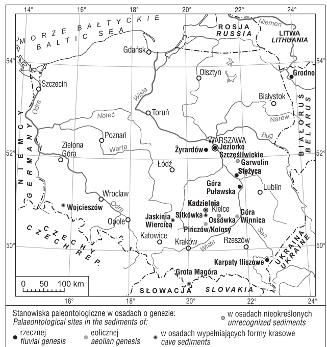
Ryc. 1. Mapa lokalizacji stanowisk paleontologicznych Fig. 1. Location of palaeontological sites

Żyrardów–Stężycza (Muz. PIG 705.II.1, 3). Dokładna lokalizacja stanowiska Żyrardów nie jest znana. Na powierzchni terenu w Żyrardowie i jego okolicach występują piaski i żwiry stożków napływowych zaliczonych przez Szalewicz (1993) do zlodowacenia wisły. Stężycza znajduje się w dolinie Wisły na północ od Dębina i jest