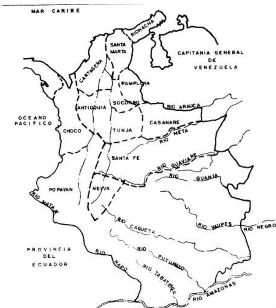
EL VIRREYNATO DE LA NUEVA GRANADA EN 1810

El Virreinato contaba 15 Provincias: Santafé, Cartagena, Santa Marta, Riohacha, Chocó, Antioquia, Popayán, Neiva, Mariquita, Tunja, Socorro, Pamplona, Casanare, Panamá, Veragua.