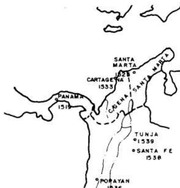
GOBERNACIONES - 1542

Hacia 1542 el actual territorio colombiano se dividía en 3 gobernaciones que surgían paralelas a la fundación de las respectivas ciudades. Esas gobernaciones fueron, en orden cronológico, Santa Marta (1525), Cartagena (1533), Popayán (1536). El Nuevo Reino de Granada que tuvo por centro a Santafé (1538) y como centro importante a Tunja (1539), dependió, para manejo y decisiones, de la gobernación de Santa Marta.