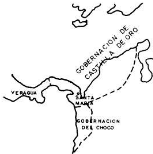
CASTILLA DE ORO - 1513

En ese mismo año de 1513 España unifica las dos primeras gobernaciones en una sola bajo el nombre de Castilla de Oro y con Pedro Arias Dávila como gobernador. En 1519 los adelantados fundan a Panamá que adquiere fuerza, en tanto que comienza la declinación de Santa María del Darién, que existe hasta 1524 cuando se extingue; duró 14 años.