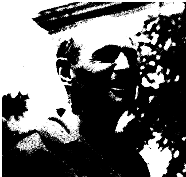
Richard Wurmbrand la doi ani după eliberare.