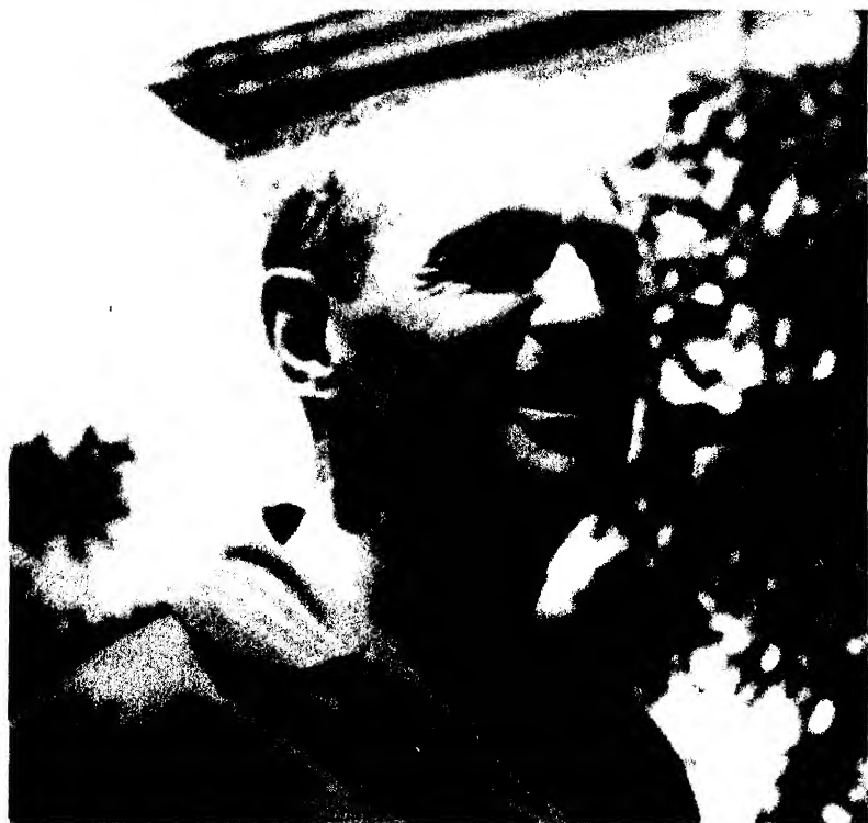
Richard Wurmbrand la doi ani după eliberare.