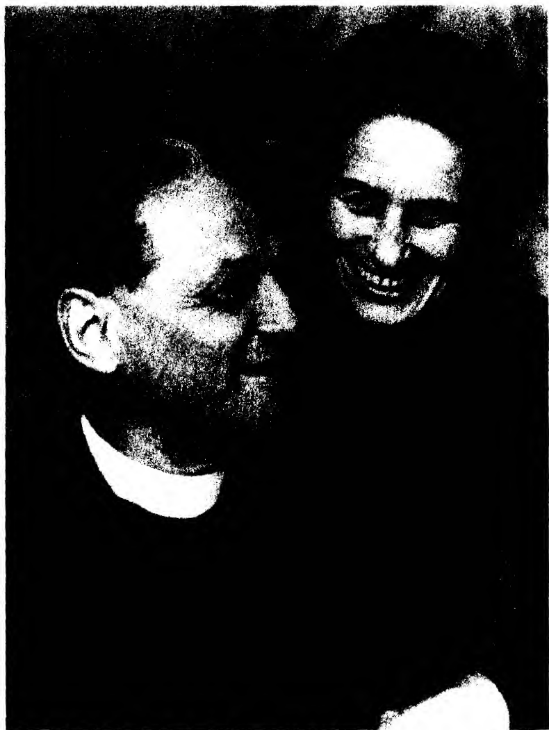
Richard și Sabina Wurmbbrand.