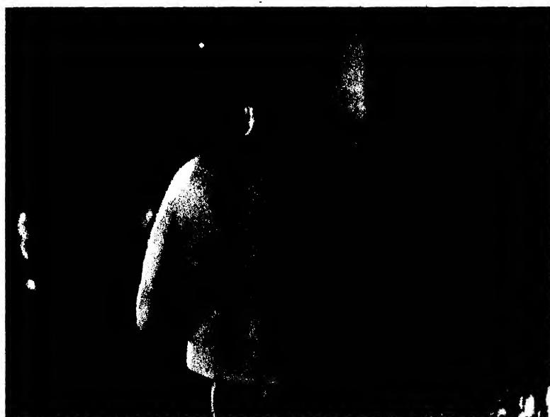
Richard Wurmbrand arătându-și rănila și depunând mărturie despre ororile comunismului în fața Senatului American în 1966.