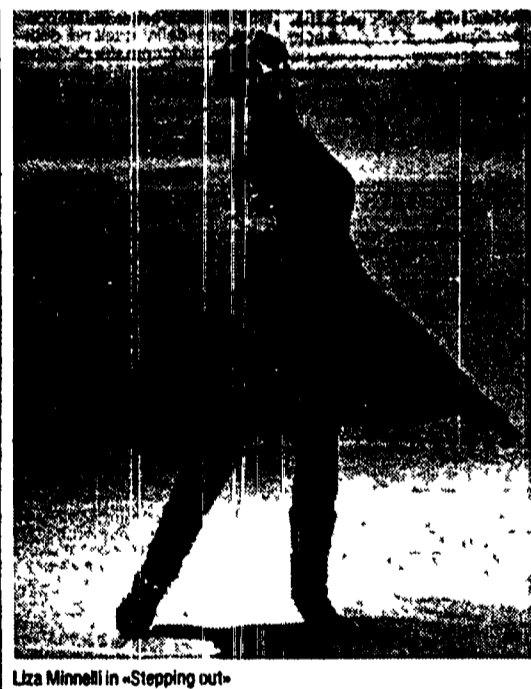
Liza Minnelli in «Stepping out»

bellissime gemelle diciottenne e una matura signora di 56 anni...»