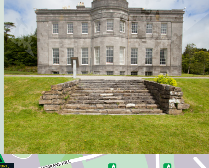
LISSADELL HOUSE, COUNTY SLIGO

West Coast Kayaking www.westcoastkayaking.ie Viaggi in acqua. Mullaghmore, County Sligo.