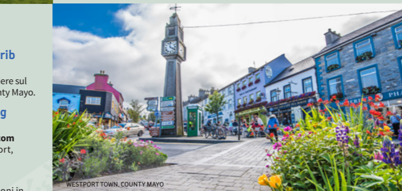
WESTPORT TOWN, COUNTY MAYO

Terra Firma Ireland www.terrafirmairland.ie Escursioni a piedi, visite culturali. Newport, County Mayo.