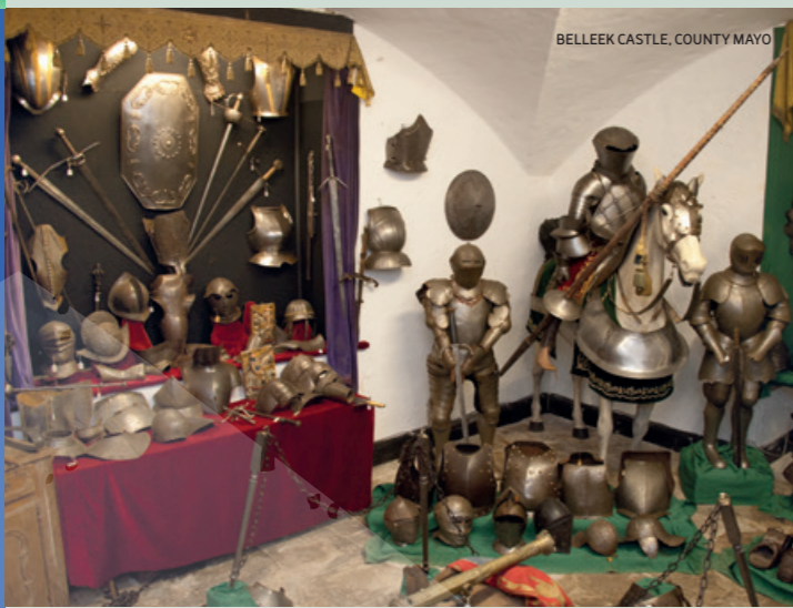
BELLEEK CASTLE, COUNTY MAYO

Knock - Ireland's National Marian Shrine and Knock Museum www.knockmusem.ie Il National Marian Shrine and Knock Museum è situato in 100 acri di splendidi giardini paesaggistici che comprendono cinque chiese dove vengono svolte messe quotidiane. Il museo racconta la storia avvincente della Knock Apparition del 1879 e la inserisce nel contesto della vita in quel momento nell'Irlanda occidentale.