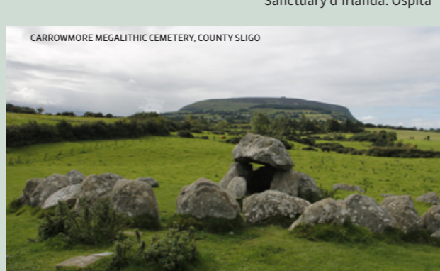
CARROWMORE MEGALITHIC CEMETERY, COUNTY SLIGO

06 Sligo County Museum www.sligoheritage.com Il Museo della Contea di Sligo espone oggetti relativi a William Butler Yeats (1865-1939) e alla contessa Markievicz (1868-1927). Viene anche presentata la storia dell'archeologia e della storia dell'area.