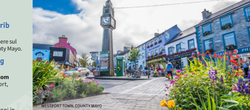
WESTPORT TOWN, COUNTY MAYO

Mullaghmore Sailing Club www.mullaghmoresailingclub.org Vela da diporto, ormeggio. Mullaghmore, County Sligo.