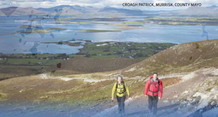
CROAGH PATRICK, MURRISK, COUNTY MAYO

A Westport, potete godere di svariate attività come passeggiate storiche, crociere, rilassanti trattamenti termali o anche divertirsi al Town Hall Theatre