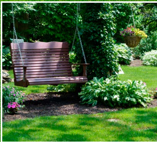
Schattenrasen (Art.Nr.: 1103042)