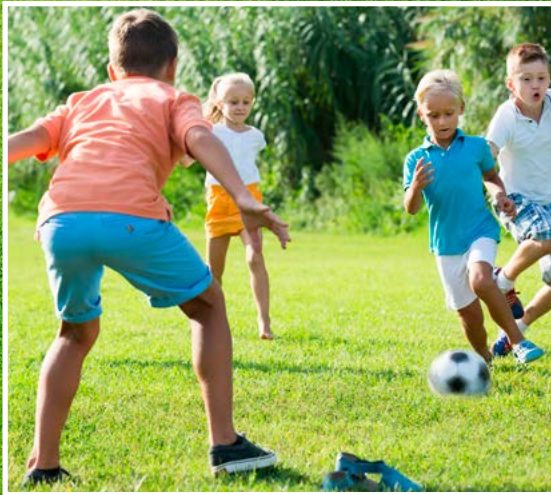
Sport- und Spielrasen (Art.Nr.: 1103040)