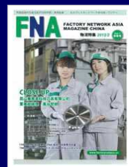
FNAマガジンチャイナ