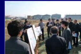
国内外視察ツアー