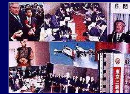
コピーサービス&amp;フォトサービス