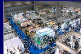
主催展示会・セミナー

ロボットやスマートグリッド、難加工、プラスチック、食品等の多様な切り口による「技術専門展」を開催。最新の業界事情や最先端の技術動向を入手できます。 一方で、子ども向けモノづくり啓発の展示会も実施。多角的な情報収集が可能です。 セミナーは技術系のものから経営全般にいたるまで、多種多様なテーマにて開催。 国内外での視察会も実施しています。 毎年12月発行「全国主要見本市・展示会一覧」も好評です。