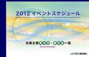
全国見本市・展示会一覧