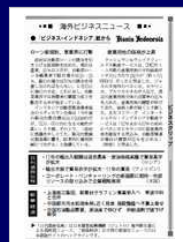
海外ビジネスニュース 日刊工業新聞の総合面(2・3面)に掲載