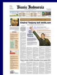
ビジネス・インドネシア