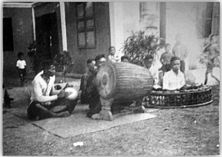
วงปี่พาทย์พื้นเมืองคุ้มเจ้าอุปราชทิพจักร ณ ลำปาง

เจ้าบุญญาภยวงษ์มานิตทรงมีวงปี่พาทย์ประจำคุ้มหลวงเพื่อใช้ในงานต่าง ๆ ภายในคุ้มหลวง ต่อมาเมื่อสิ้นยุคคุ้มหลวง พระสีหสุวรรณวิสุทธิ (สิงห์คำ จันทบุรีโส) อดีตเจ้าอาวาสวัดเชียงราย จังหวัดลำปางได้ขอทางทายาทนำมาเก็บรักษาไว้ ณ โรงเก็บชั่วคราวหลังกุฏิของท่าน ปัจจุบันพบเพียงแต่กลองติดตั้งหรือตะโพนมอญ (กลองสำหรับพ้อนผี) ๓๒ แต่อย่างไรก็ตามทรงส่งเสริมวงปี่พาทย์ในระดับราษฎรด้วย โดยมีการส่งเสริม ๒ รูปแบบ ดังนี้