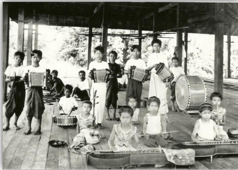
วงปี่พาทย์มโหรี ของคຸ່มเจ้าอุปราชทิพจักร ณ ลำปาง (ปัจจุบันคือที่ว่าการอำเภอเมืองลำปาง)

เจ้าบุญวาทย์วงษ์มานิตได้ลงไปเข้าเฝ้าฯ พระพุทธเจ้าหลวงในโอกาสต่าง ๆ อยู่เนือง ๆ ในแต่ละครั้งใช้เวลา ๓-๕ เดือน แล้วกลับนครลำปาง ในระหว่างนี้จึงมีโอกาสสัมผัสและชื่นชมความศิวิไลซ์ของเมืองหลวง หนึ่งในนั้นคือความบันเทิงจากเสียงมโหรีปี่พาทย์ของสำนักวังต่าง ๆ เช่น วังบางขุนพรหม วังเทเวศร์ ซึ่งมักประชันแข่งกันเสมอ เจ้าหลวงมีแนวคิดจะนำมาเผยแพร่ที่คຸ່มหลวง โดยนำครูที่กรุงเทพฯ ขึ้นมาหัดให้กับข้าราชการบริพารเพื่อใช้ในงานสโมสร และรับเสด็จฯ พระบรมวงศานุวงศ์ แห่งพระราชวงศ์จักรี ๓๐ จนแพร่ออกไปตามคຸ່มเจ้านายบรรดาศักดิ์ต่าง ๆ ในนครลำปาง เช่น คຸ່มเจ้าอุปราชทิพจักร ณ ลำปาง เป็นต้น อีกทั้งยังทรงให้บรรดาม่อมหัดเล่นเครื่องดนตรีแบบกรุงเทพฯ เช่น หม่อมผัน ทรงให้หัดเป่าขลุ่ย และ หม่อมจ้อน แห่งบ้านปงวังนครลำปาง ทรงหัดให้เล่นจะเข้ และโปรดให้ตีตบถายในยามบรรทมอีกด้วย ๓๑