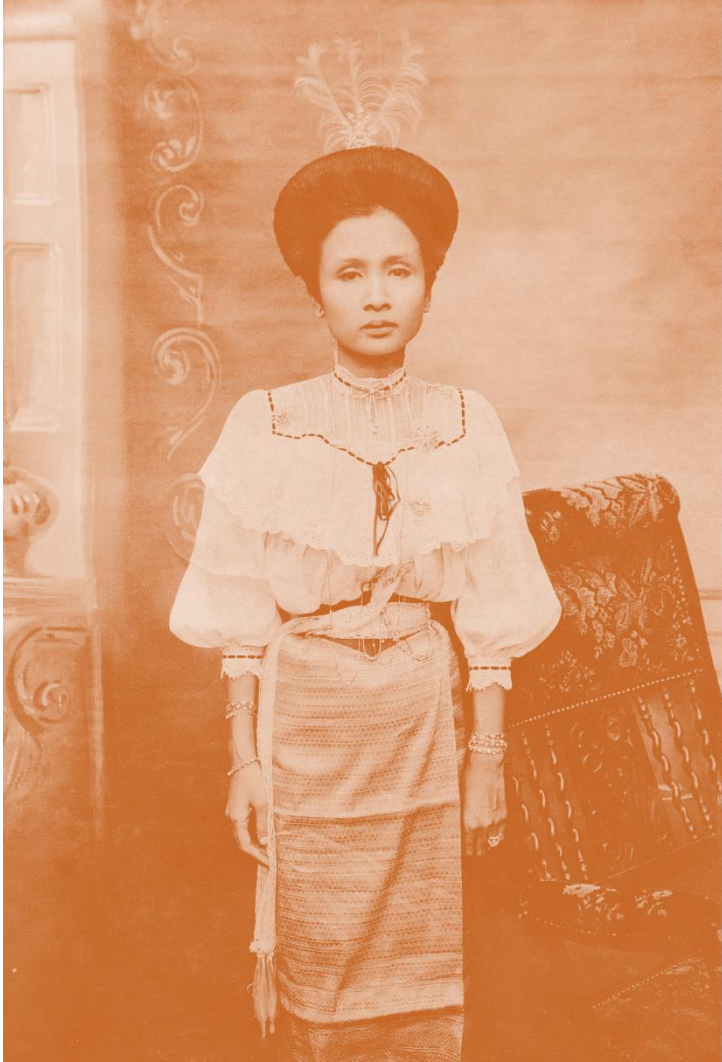
เจ้าหญิงศรีนวล ณ ลำปาง