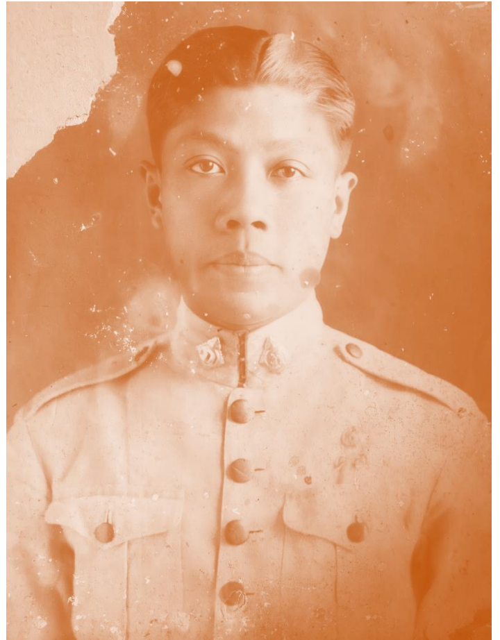
เจ้าบุญส่ง ณ ลำปาง ต.จ.ว.