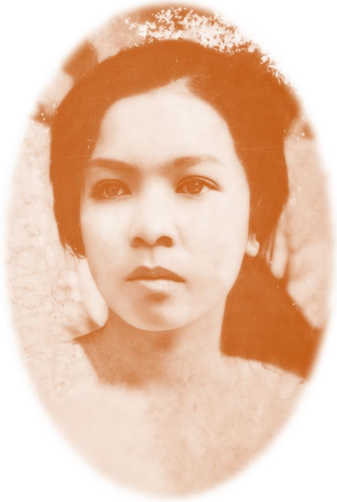
เจ้าหญิงอำภร มณีอรุณ