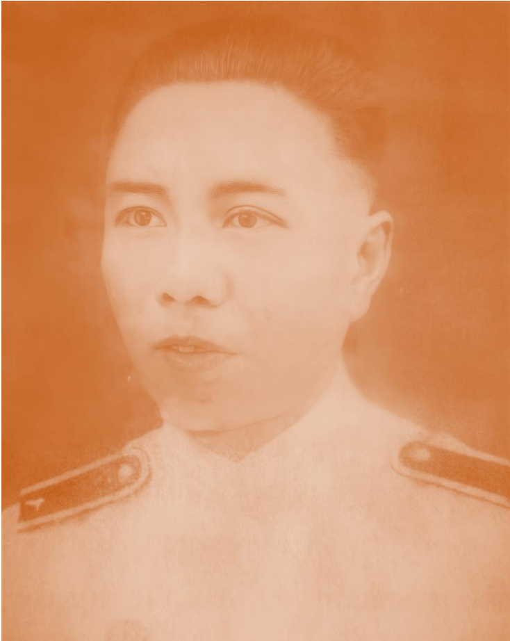
เจ้าบุญสารเสวตร์ ณ ลำปาง