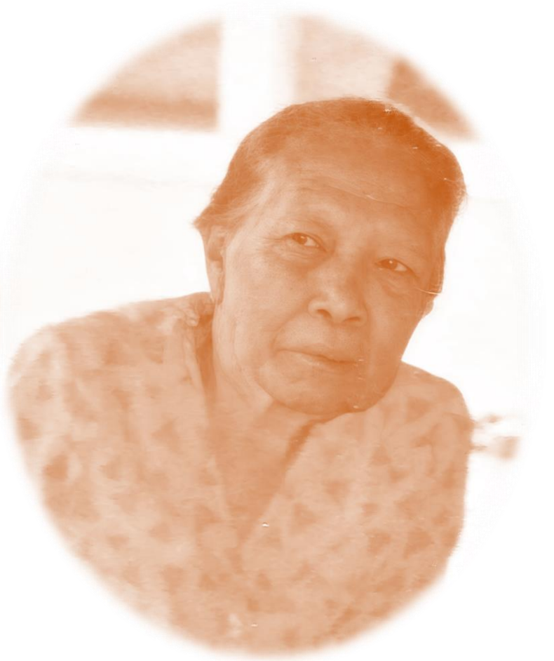
เจ้าหญิงบัวจอม ฅ ลำปาง