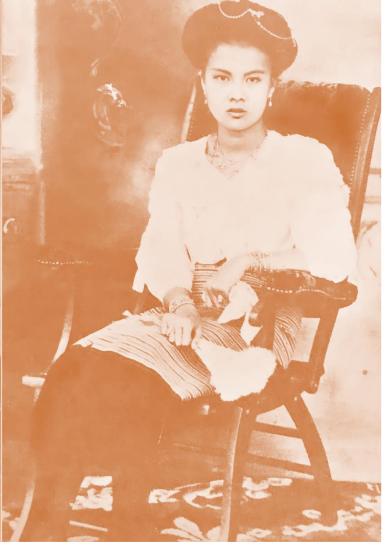
เจ้าหญิงอัม พราหมณพันธ์