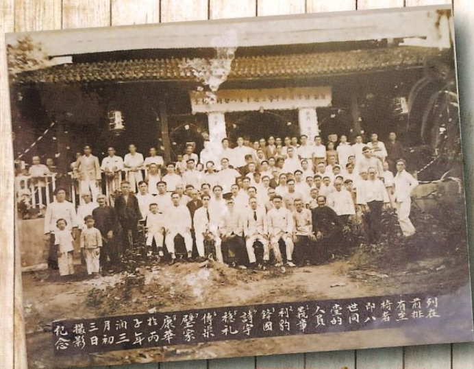
列在 前推 椅若 世同 雲的 人員 的約 錦國 詩守 禮家 壁家 康年 於丙 潤三 月三 日初 三念 禮影