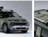
크로스 바 (사이드 어닝 전용)