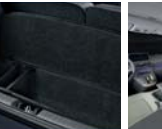
러그지 박스 1.0