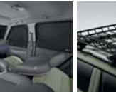
멀티 커튼 (전면/1열/2열)