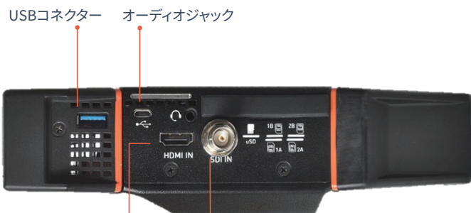
HDMI入力コネクタ SDI入力コネクタ