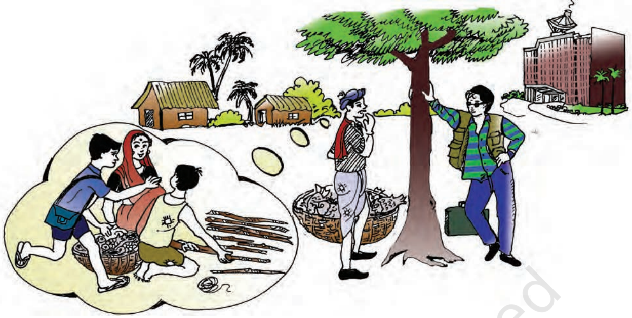
चित्र 2.2 : विलास एवं सकल की कहानियाँ