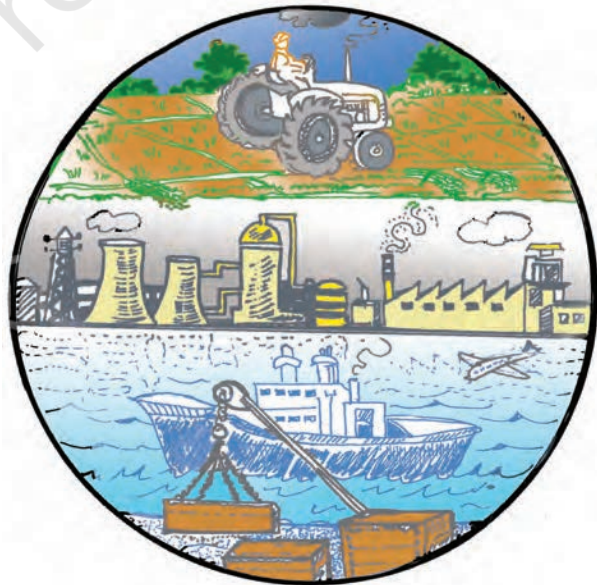
चित्र 2.3 : क्या आप इस चित्र के आधार पर क्रियाकलापों को तीन क्षेत्रकों में वर्गीकृत कर सकते हैं?

विलास और सकल की तरह लोग विभिन्न क्रियाकलापों में संलग्न हैं। हमने देखा कि विलास मछलियाँ बेचता था और सकल को एक फ़र्म में नौकरी मिल गई थी। विभिन्न क्रियाकलापों को तीन प्रमुख क्षेत्रों-प्राथमिक, द्वितीयक और तृतीयक में वर्गीकृत किया गया है। प्राथमिक क्षेत्रक के अंतर्गत कृषि, वानिकी, पशुपालन, मत्स्यपालन, मुर्गीपालन और खनन एवं उत्खनन शामिल हैं। द्वितीयक क्षेत्रक में विनिर्माण शामिल है। तृतीयक क्षेत्रक में व्यापार, परिवहन, संचार, बैंकिंग, बीमा, शिक्षा, स्वास्थ्य, पर्यटन सेवाएँ इत्यादि शामिल किए जाते हैं। इस क्षेत्रक में क्रियाकलाप के फलस्वरूप वस्तुओं और सेवाओं का उत्पादन होता है। ये क्रियाकलाप राष्ट्रीय आय में मूल्य-वर्धन करते हैं। ये क्रियाएँ आर्थिक क्रियाएँ कहलाती हैं। आर्थिक क्रियाओं के दो भाग होते हैं- बाज़ार क्रियाएँ और गैर-बाज़ार क्रियाएँ। बाज़ार क्रियाओं में वेतन या लाभ के उद्देश्य से की गई क्रियाओं के लिए पारिश्रमिक का भुगतान किया जाता है। इनमें सरकारी सेवा सहित वस्तु या सेवाओं का उत्पादन शामिल है। गैर-बाज़ार क्रियाओं से अभिप्राय स्व-उपभोग के लिए उत्पादन है। इनमें