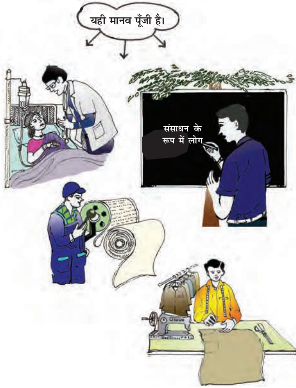
चित्र 2.1 : मानव पूँजी