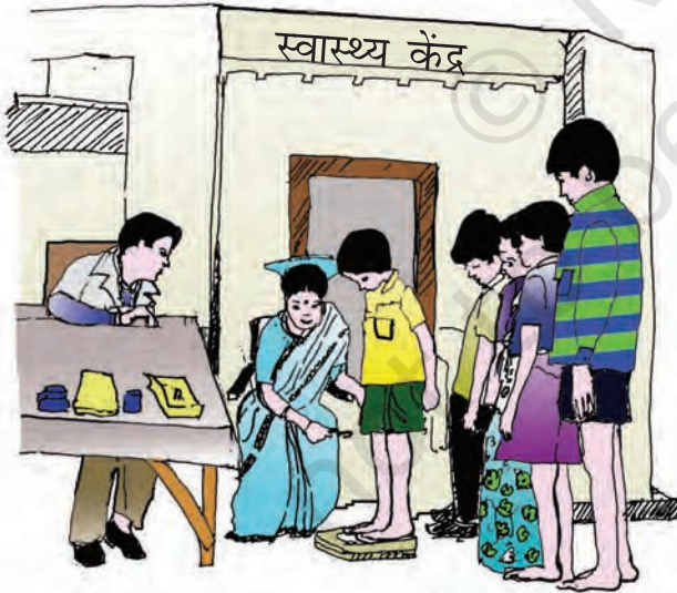
चित्र 2.5 : स्वास्थ्य की जाँच के लिए एक पंक्ति में खड़े हुए बच्चे

किसी व्यक्ति का स्वास्थ्य उसे अपनी क्षमता को प्राप्त करने और बीमारियों से लड़ने की ताकत देता है। ऐसा कोई भी अस्वस्थ स्त्री/पुरुष संगठन के समग्र विकास में अपने योगदान