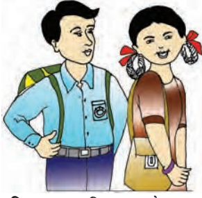
चित्र 2.4 : विद्यालय के छात्र-छात्रा

करती है और प्रशासन की कार्य-क्षमता बढ़ाती है। प्राथमिक शिक्षा में सार्वजनिक पहुँच, धारण और गुणवत्ता प्रदान करने का प्रावधान किया गया है और इस मामले में लड़कियों पर विशेष जोर दिया गया है। प्रत्येक जिले में नवोदय विद्यालय जैसे