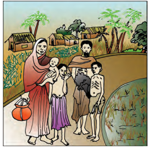
चित्र 4.2 : 1943 के बंगाल के अकाल के दौरान पूर्वी बंगाल के चटगाँव ज़िले में गाँव छोड़ कर जाता हुआ एक परिवार।