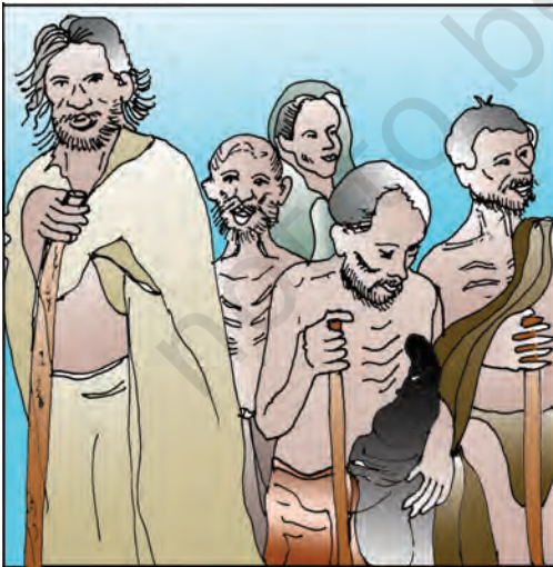
चित्र 4.1 : राहत केंद्र पर भुखमरी से पीड़ित लोग, 1945