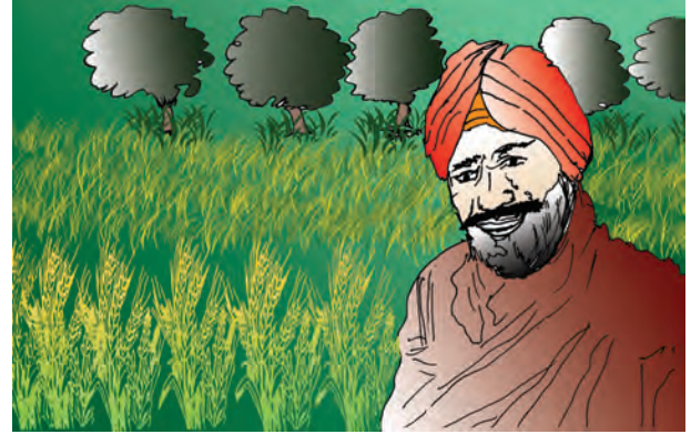
चित्र 4.3 : पंजाब का एक किसान एच.वाई.वी. प्रकारों वाले गेहूँ के एक खेत के सामने, जिस पर हरित क्रांति आधारित है

तत्कालीन प्रधानमंत्री इंदिरा गांधी ने जुलाई, 1968 में 'गेहूँ क्रांति' शीर्षक से एक विशेष डाक टिकट जारी कर कृषि के क्षेत्रक में हरित क्रांति की प्रभावशाली प्रगति को आधिकारिक रूप से दर्ज किया। गेहूँ की सफलता के बाद चावल के क्षेत्र में इस सफलता की पुनरावृत्ति हुई। बहरहाल, अनाज की उपज में वृद्धि समानुपातिक नहीं थी। उत्तर प्रदेश और मध्य प्रदेश में