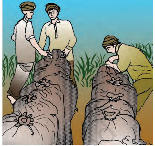
चित्र 4.5 : भंडारों में खाद्यान्न ले जाते हुए किसान

एन.एस.एस.ओ. न. 558 की रिपोर्ट के अनुसार ग्रामीण भारत में प्रति व्यक्ति चावल की खपत 6.38 किग्रा. वर्ष 2004-05 से घटकर 5.98 किग्रा. वर्ष 2011-12 में हो गया।