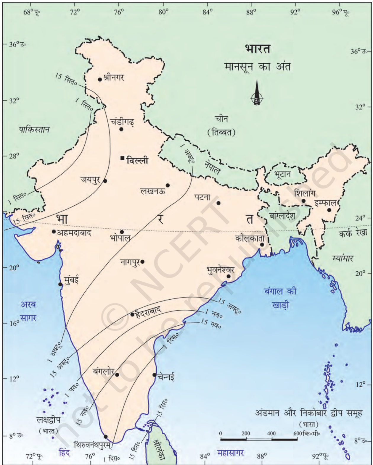
चित्र 4.2 : मानसून का अंत