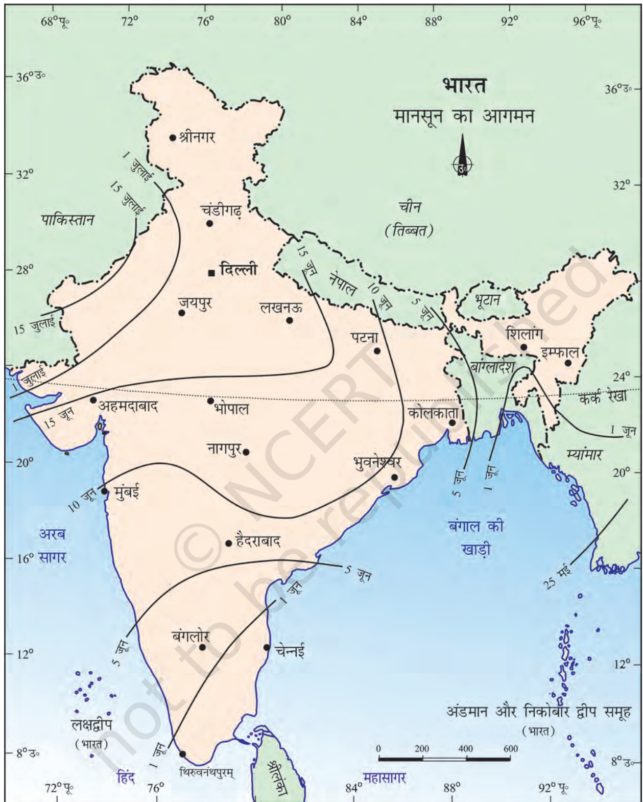
चित्र 4.1 : मानसून का आगमन