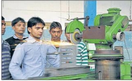
फरीदाबाद की आईटीआई में प्रशिक्षण लेते छात्र।

वहीं, आईसीटी के जरिए शिक्षकों के प्रशिक्षण को घोषणा को भी सराहया गया। इससे शैक्षणिक गुणवत्ता में सुधार होगा। ये बजट युवाओं को हुनरमंद बनाने में सहायक साबित होगा। बजट में एकीकृत रिकल इंडिया डिजिटल प्लेटफॉर्म