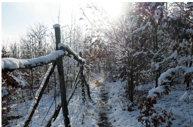
Závěrečný úsek cesty k pomníčku

Téměř až k němu vás dovede žlutá značka. Vyjdete na hřeben Hory (třeba po červené značce na rozcestí Pod Sychrovem ) a pokračujete po žluté směř Medláanky. Od rozcestníku s označením Velká Baba ale už musíte po neznacené cestě oddělující se doleva od pokračující žluté, nejprve k samotné-