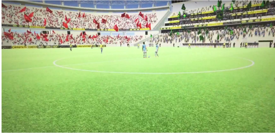
Şekil 2. Maçın Başlama Anındaki Seyircilerin Durumu

İkinci etmen olan seyircilerin gerçekliğe uygun olması amacıyla farklı şekilde tasarlanan insan modelleri stadyum içerisinde olan koltuklara yerleştirilmiştir (Şekil 2).