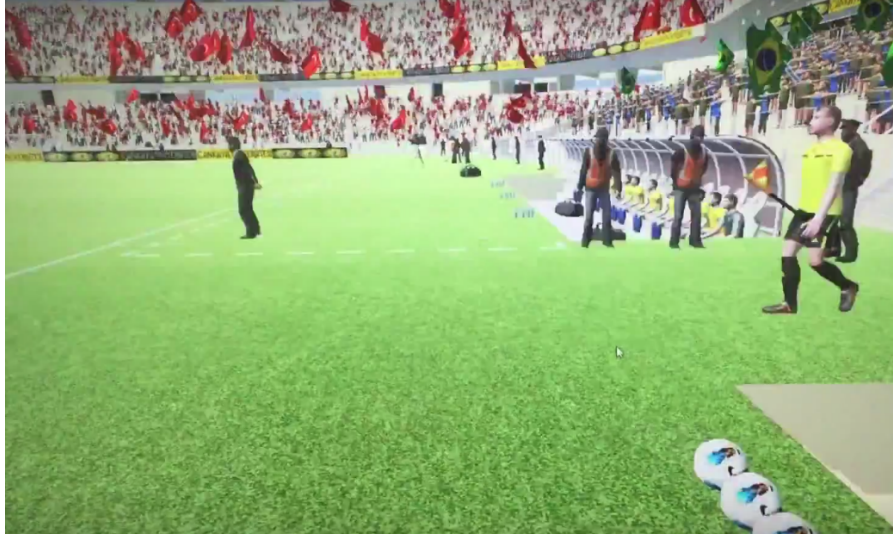
Şekil 3. Saha İçi Malzemeleri

Bir diğer etmen olan saha içi kullanılmak üzere malzemelerin gerçek hayat ile standart olabilmesi için Şekil 3'te de görüldüğü üzere simülasyon programında gerçek hayatta kullanılan hakem bayrağı ve futbol topu kullanılmıştır.