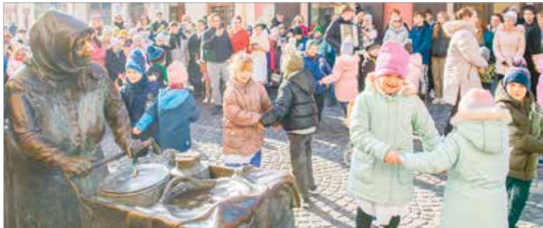
Kora délután a Felsővárosi Általános Iskola diákjai a dalok mellett piacos mondókákkal, népi játékokkal köszöntötték városrészük egykori lakóját