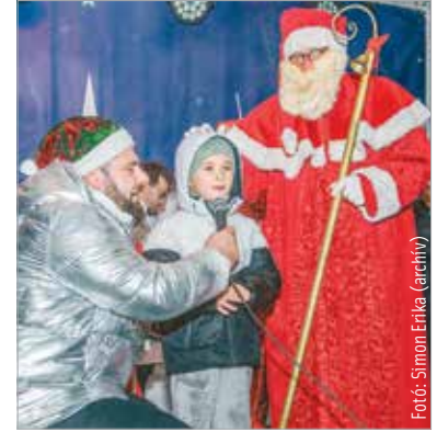
A Mikulás december hatodikán délután ötkor érkezik a Városház térre, az ajándékosztás után pedig elindul Fő utcai sétájára

A hagyományoknak megfelelően a belvárosban is találkozhatnak a gyerekek a Mikulással. December hatodikán délután négy órától rengeteg játék, móka vár a kicsikre a Városház téren. A programot a Szabad Színház Az elcserejt ajándékok című interaktív műsora indítja, ez gyerekeknek és gyermeklelkű felnőtteknek egyaránt szól. A történet a Mikulásgyárban játszódik, ahol az ünnep közeledtével óriási a hajtás – ezért a Mikulás-főközpont manóinak