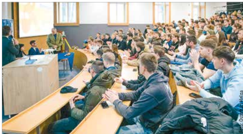
Szinte a csillár is lógtak az Óbudai Egyetem fehérvári campusán