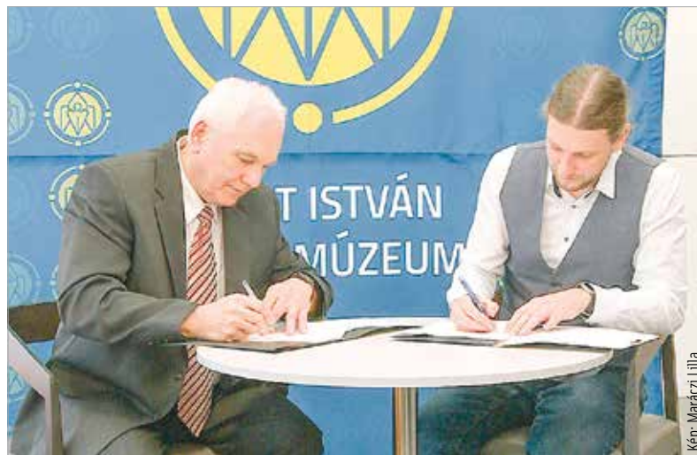
A történelem bemutatása élővé és színessé válhat