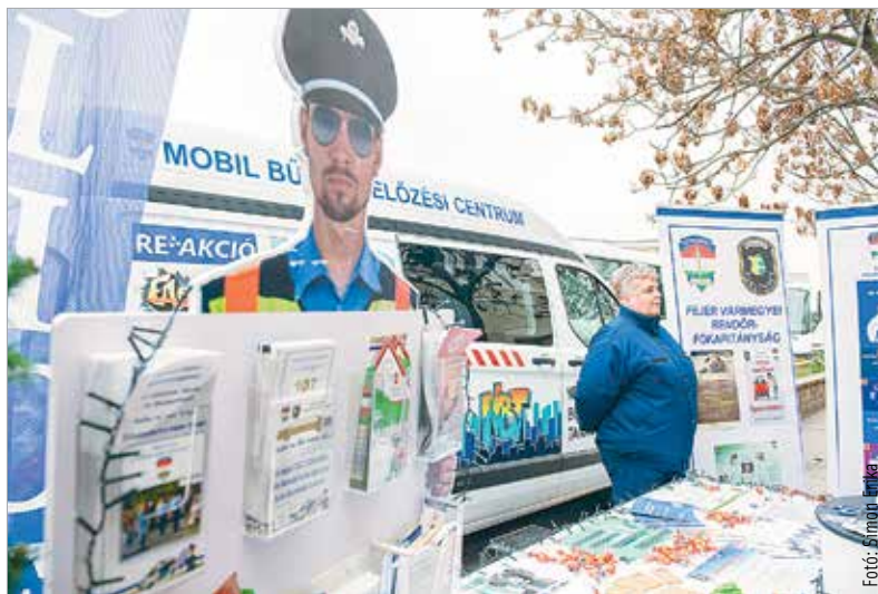
Az Áldozatsegítő Központok országszerte nyitva lesznek a két ünnep között is, és az ünnepnapokon is működik majd az ingyenesen hívható 80 225 225-ös telefonszámuk