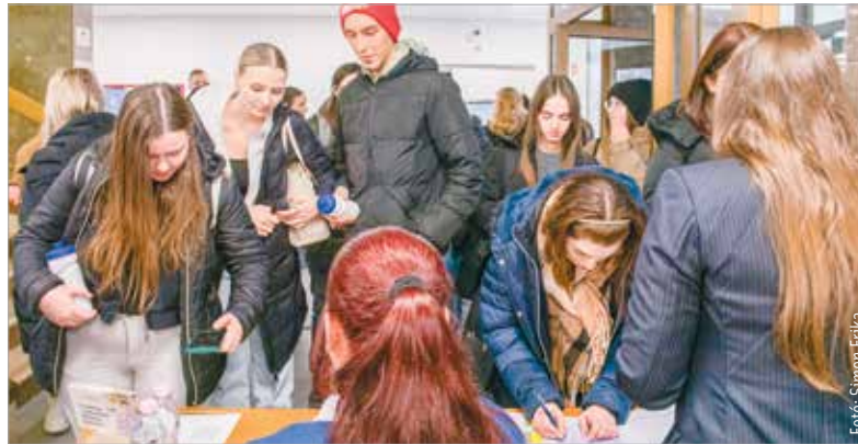
Sokan voltak kíváncsiak a Kodolányi nyolc, Fehérváron induló képzésére is