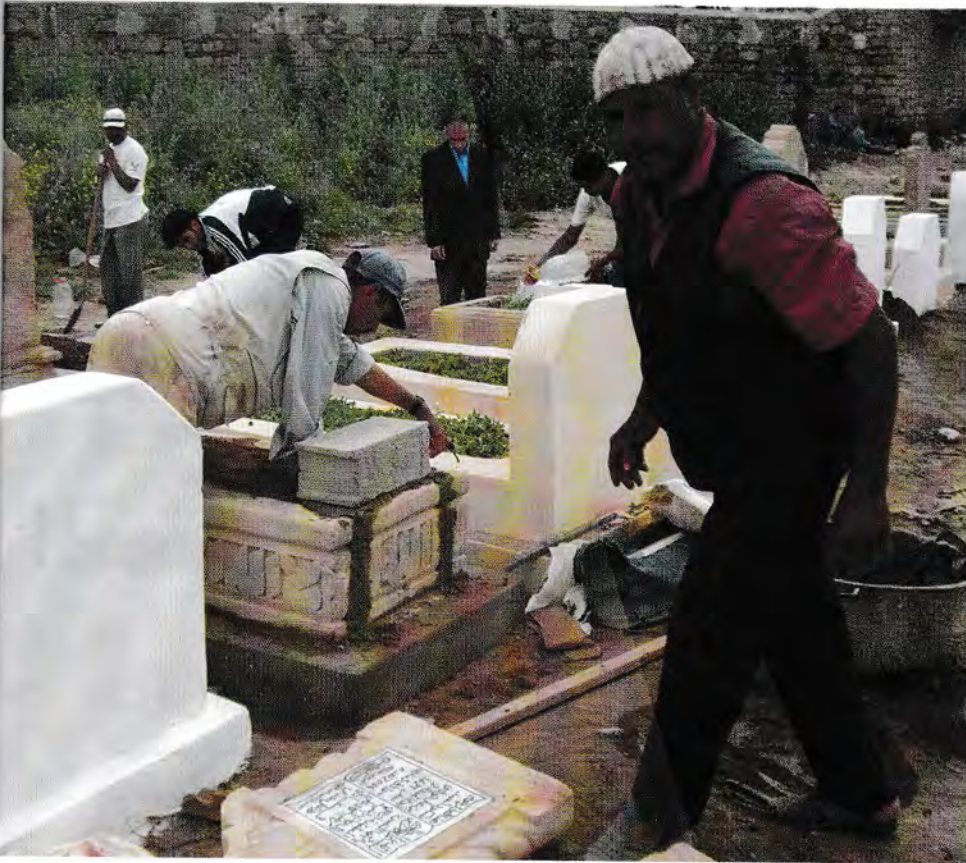
الموت كتحلق حرافى عايشين منها بعض الناس.

أَرْضُ مَقْبَرَةِ سَيِّدِي بِنَعَاشَرِ دِيَالِ الْأَخْبَاسِ. مَقَابِلَهَا الْحَاجُّ الْمُبَارَكِي مَنْ بَعْدَ عَمَامُو 2 وَالْأَبُ دِيَالُو. مَكْلَفِينَ