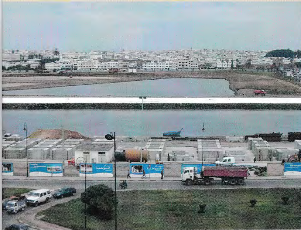
بين سلا والرباط كايين فرق أوسع من عرض الواد.

15% مِن سُكَّانَهَا مَا تَيْسْتَأْفُدُوش مِن المَاء الصَّالِح الشَّرْب و 13% مَا عَنْدَهُومش الضو. سلا سَبَقَات مَدُن بَحَال وَجَدَة فَاس. المُفاجأة الكَبيرة أَنهَا سَبَقَات مُرَاكش.