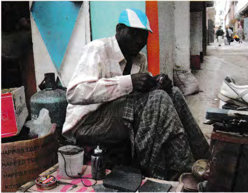
من غانا لتأخرات في سلا...

بَعْدَمَا هَاجَرَ مِنْ بِلَادُو، غَانَا، كَانَ حُلْمُو يَوْصِلُ لِبِلَادِ أوروپية. لَكِنْ مُغَامَرَتُو تَوَقَّفَاتِ فِي سَلَا.