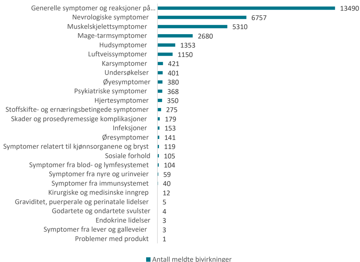
Figur 2: Meldte mistenkte bivirkninger fordelt etter kategori for Vaxzevria (AstraZeneca) og COVID-19 Vaccine Janssen

Legemiddelverket har mottatt 14 meldinger om mistenkte bivirkninger etter vaksiner med COVID-19 Vaccine Janssen. Hendelsene er klassifisert som lite alvorlige. Meldingene er ikke ferdig saksbehandlet og er derfor ikke inkludert i tallene i denne ukens rapport.