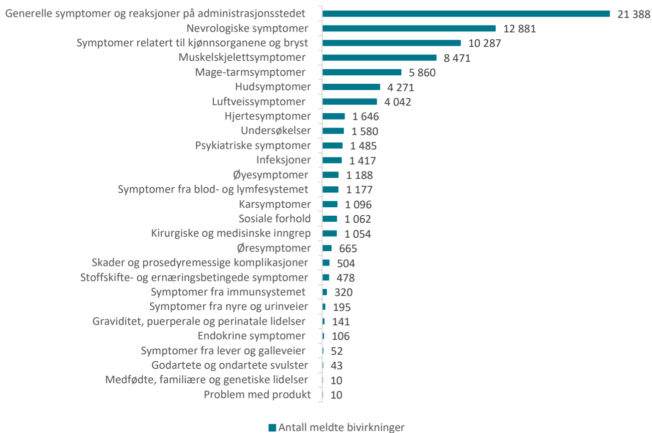
Tabell 6: Meldte mistenkte bivirkninger fordelt etter kategori for Comirnaty og Spikevax

En melding kan inneholde flere bivirkninger og dermed er det langt flere bivirkninger enn meldinger.