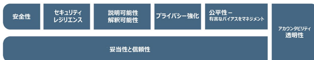
図 4. トラストワージな AI システムの特徴。妥当性と信頼性はトラストワージの必要条件であり、他のトラストワージの特性のベースとして示されています。アカウントビリティと透明性は、他のすべての特性に関連するため、縦長の枠で示されています。

AI システムがトラストワージであるためには、多くの場合、利害関係者にとって価値のある多様な基準に対応する必要があります。AI のトラストワージを高めるアプローチは、AI のネガティブなリスクを低減することができます。本フレームワークは、信頼できる AI の特徴を以下のように明確にし、それらに対処するためのガイダンスを提供します。トラストワージな AI システムの特性には、 妥当性と信頼性、安全性、セキュリティ、レジリエンス、アカウントビリティと透明性、説明可能性と解釈可能性、プライバシー強化、有害なバイアスを管理した公正性 が含まれます。トラストワージな AI を作るには、AI システムの使用状況に基づいて、これらの各特性のバランスを取る必要があります。すべての特性は社会技術的なシステム属性ですが、アカウントビリティと透明性は AI システム内部のプロセスと活動およびその外部設定にも関係します。これらの特性をおろそかにすると、否定的な結果が生じる確率と規模が増大する可能性があります。