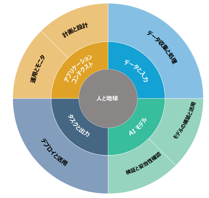
図 2. AI システムのライフサイクルと主要な次元 OECD。 (2022) OECD Framework for the Classification of AI systems - OECD Digital Economy Papers より改変。内側の 2 つの円は AI システムの主要な次元を示し、外側の円は AI のライフサイクルの段階を示しています。理想的には、リスクマネジメントの取り組みは、アプリケーションのコンテキストにおける計画と設計の機能から始まり、AI システムのライフサイクル全体を通じて実行されます。代表的な AI アクターについては、図 3 を参照してください。

環境団体、市民社会組織、エンドユーザ、そして潜在的に影響を受ける個人やコミュニティ。これらのアクターは次のことができます：