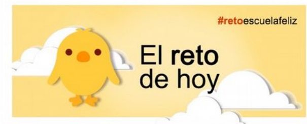
El reto 5: ¿Pensamos en positivo?