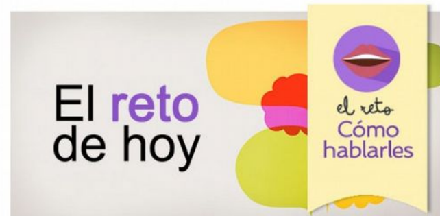
El reto 7: Explicaciones sencillas