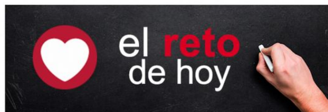
El reto 7: Límites sí, pero pocos