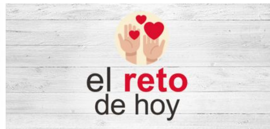
El reto 2: La pastilla del optimismo