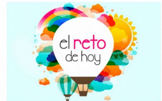
El reto 12: Top secret