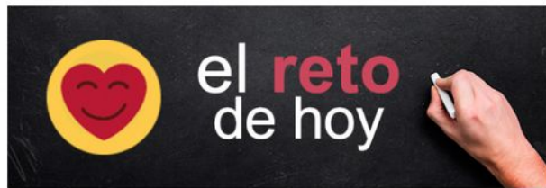
El reto 10: Las gafas especiales

Cada día enseñamos una idea, tip o técnica para mejorar