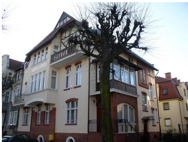
ul. Grunwaldzka 23