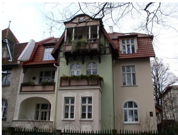
ul. Fiszera 2