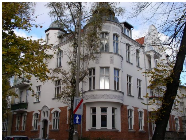
ul. Chmielewskiego 9