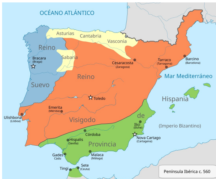
Provinse Spania en la anio 560.

conquista de Toulouse par la francos e la perde de la plu territorios en lo cual es oji Frans, los ia move sua capital a Toledo.