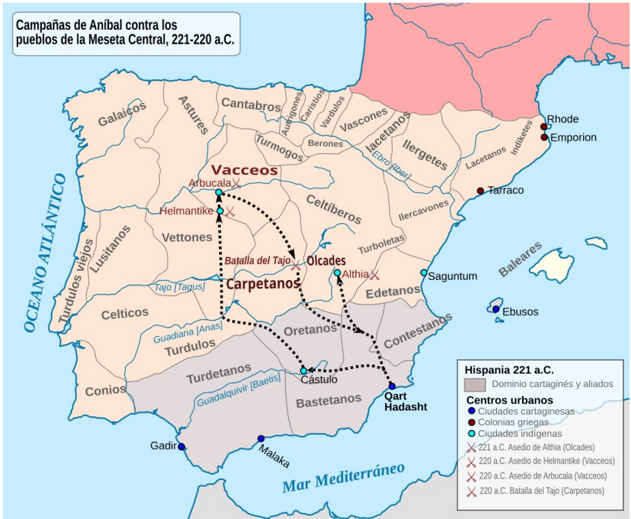
Batalias de Aníbal contra la poplas de la Plano Alta Sentral (Meseta Central).

Con la arjento de acel minas los ia paia a sua mersenarios e, cuando los ia perde la site en 209 AEC, Anibal no ia pote resiste la romanes, donece la perde de Cartagena ia deside ance la gera de Anibal.