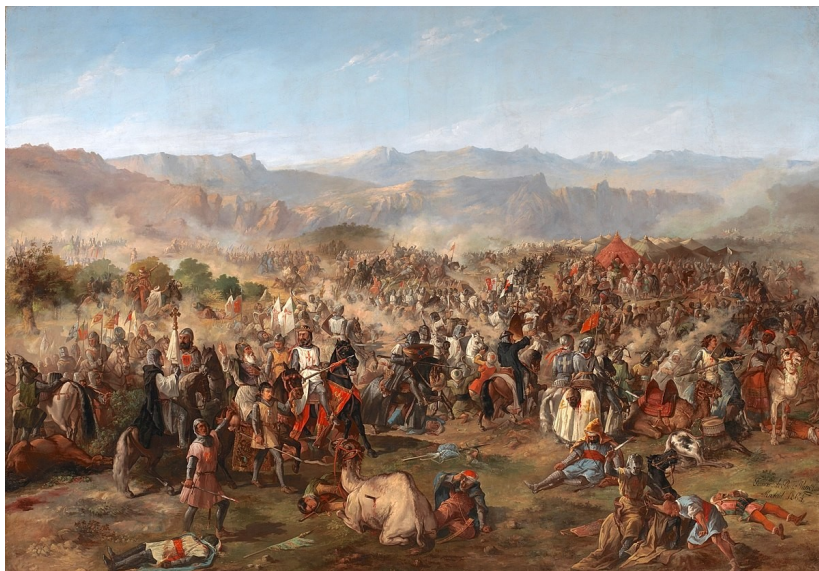
La batalia de Navas de Tolosa en 1212 ia marca la comensa de la fini de la renas muslim en Espania.

de la norde de Africa e ia institui un impero nova. En la sentenio 12, la impero almoravide ia rompe denova, per deveni concistada par la invade almohade, ci ia es vinseda en la batalia desidente de las Navas de Tolosa en 1212.