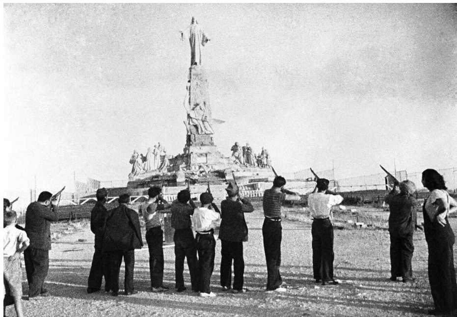
Sinistristes espaniol xutante la sculta de la Cor Santa en la Cerro de los Angeles en 1936. La atacas de la sinistristes a relijio e relijiosas ia es un de la causas de la gera interna espaniol.

Barcelona, Valencia, Malaga e Euscadi ia sinifia la comensa de la gera interna. En poca tempo, la plu de la sude e ueste ia es su controla nasional, de ci sua soldatos de Africa ia es la plu profesales de la gera. Ambos partes ia reseta ajuda stranjer: la nacionales de Deutxland nazi, Italia faxiste e la autocracia de Portugal, en cuando la armada de la Republica ia es aidada par la Uni de Republicas Sosialiste Soviet, Mexico gidada par Lazaro Cardenas del Rio, presidente de la Partido de la Revolui Mexican, e la Brigadas Internacional, formida par sosialistes, comunistes e anarcistes ci ia ariva de tota partes de la mundo.