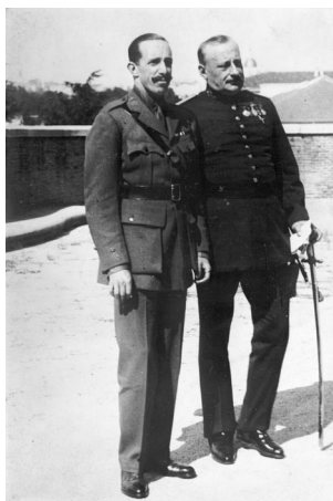
La re Alfonso 13 e Miguel Primo de Rivera en 1930.

A 13 setembre 1923, la capitan jeneral de Catalonia, Miguel Primo de Rivera, ia revolta contra la governa e ia fa un colpa de stato con la suporta de la plu de la militares. La causa de esta revolta ia es la reuni prevedida per la Cortes Jeneral per analise la problem de Maroco e la rol de la armada en la gera. A esta situa ia es ajuntada un crise importante de la sistem monarcal cual no ia fini sua ajusta en la sentenio 20 marcada par la revolui industrial aselerada, un rol no reconoseda de la burjesia, la tensas nasionaliste e la partitos political tradisional noncapas de fronti un governa democrata plen.