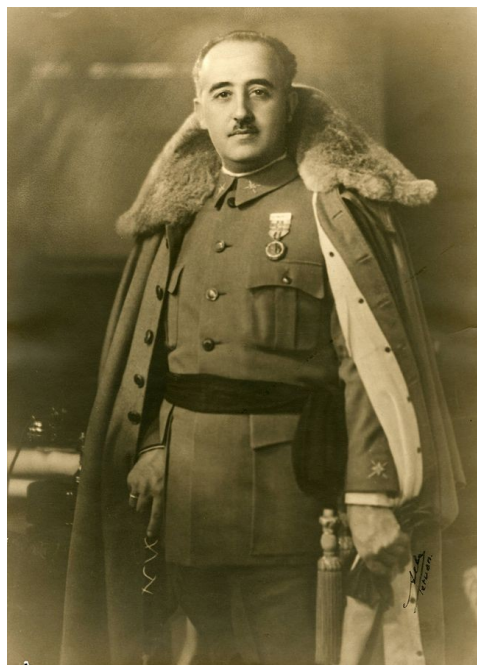
Francisco Franco ia governa Espania entre 1939 e 1975.