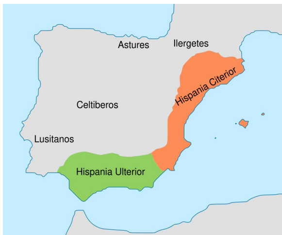
La divide provinsal prima de Hispania par la romanes.

Pos la Gera Punic Du entre 218 AEC e 201 AEC, on pote considera la penisola Iberian su controla de Roma. La batalia per ocupa, pos la espulsa cartagan, ia es rapida, estra a interna (Numantia) e la popla cantabrian ci ia resiste asta la ariva de Augusto en la comensa de la Impero Roman.