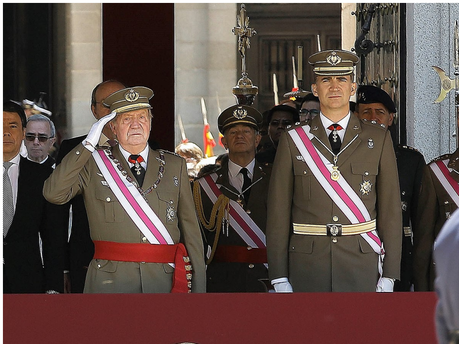
La re Juan Carlos 1 e sua fio, ci ia erita la trono en 2014.

En 2020, un state de alarma ia es declarada sur la pandemica de COVID-19, e la move de persones es restrinjeda. En 2021, la presidente de la governa, la socialiste Pedro Sanchez, ia aproba la pardona a la condenadas par la prosede catalan cual ia fini con la proclama de nondepende catalan.