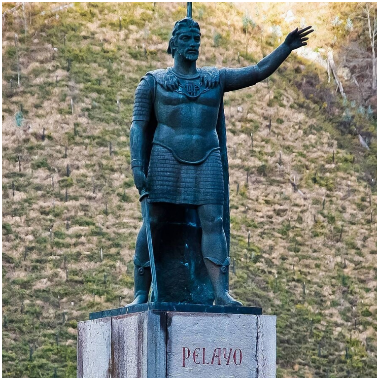
Sculpta de Sir Pelayo en Covadonga.

Sirca la anio 722, un grupo de soldatos muslim ia es vinseda par un grupo de refujadas cristian en la forestas de Covadonga (Asturias) en la batalia omonim. Sir Pelayo, probable un nobil goto, ia es nomida re. La corte prima ia es instituida en Cangas de Onís. Pelayo ia mori en 737. A du anios plu tarda (739) sua fio par sposi, Alfonso 1, fio de Pedro de Cantabria, profitante la lutas entre la arabis e la berberes, ia dona un impulsa nova a la reconcista, arivante a Rioja e la Rio Duero. Ma el no ia pote repopla lo, donce ala un deserto stratejial ia resta, un tera de nun en la plano alta norde.