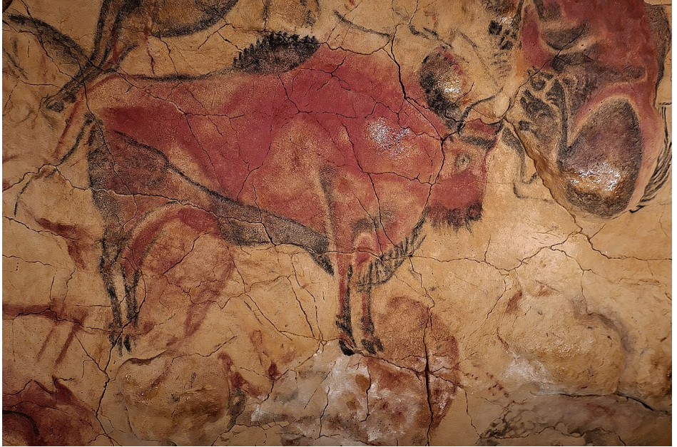
Bison en la Cava de Altamira.

La presència de ominídeos en la Península Ibèrica origina a mínima de 1,3 o 1,2 milions d'anys passada, datada d'una mandíbula trobada en la Sima del elefant, un dels situats en la Siera de Atapuerca (província de Burgos). Li correspon a un Homo encara no determinada, propera a Homo african la més primitiva i la Homo Dmanisi però amb algunes característiques derivades pròpies. D'aquesta època és també la situació de Fuente Nueva, en la basínia de Guadix-Baza (província de Granada).