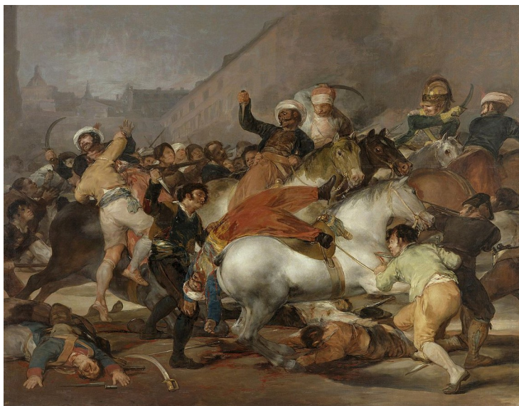
La carga de la mamalucas, par Goya.