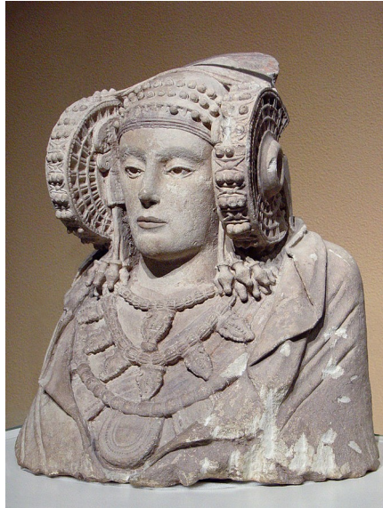
La Dama de Elig.

La eda de fero comensa en la penisola Iberian con la penetra de poplas e influes cultural indoeuropean de la comensa de la 1 milenio AEC, determinante la identia etnico e linguistica celta de la plu de la poplas nativa de la zonas norde, ueste e sentro, con alga esetas: lusitanianes e vetones, ance indoeuropean, es clasida como "precelta" contra ce la euscaras es clasida como "preindoeuropean". An con la similia de sua formas de vive a acel de otra poplas de la zona norde (galecos, astures e cantabrianes), on crede ce sua lingua (la protoeuscara) es simil a los parlada en la zona este de la penisola; los de la iberianes, de un desenvolpa economial plu alta. La fontes clasica ia nomi celtiberianes a la grupo de poplas situada en un zona media (jeografial).