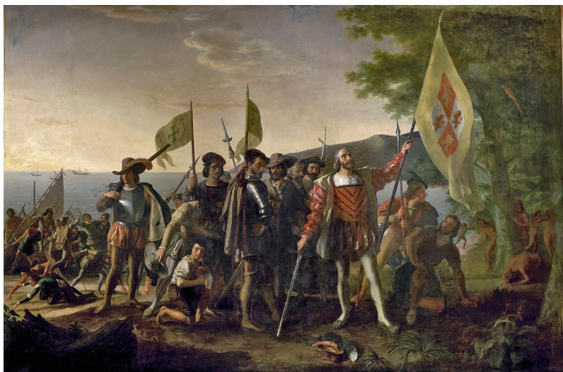
Atera de Colombo en la isola Guanahani en 1492.

En 1469, con la sposi de Isabel e Fernando, prinse erital de Aragon, la uni dinastial de la renas de Castelia e Aragon ia es completida, an si ambos territorios ia manteni sua propre lejes e instituidas asta 1707 4 ma su la comanda de la mesma re.