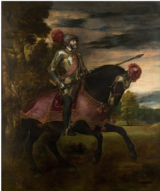
La imperor Carlos 1 en Mühlberg, par Tiziano.

Con Carlos 1 la rena comensa de la dinastia Habsburg, o Casa de Osterreich, en cual Espania ia conose sua estende teritorial la plu grande, con gracias a la conquista de territorios en America e otra locas ultramar. Plu, la re Carlos 1 ia es coronida como imperor de la Impero Roman Santa como Carlos 5, cual ia ajunta territorios estendosa a la Corona e, a pos, Felipe 2 ia aumenta la territorios en America e ia oteni la corona de Portugal con sua territorios ultramar, comensante un periodo (1580-1640) en cual la dominas de la Monarca Catolica ia deveni la potia economial e militar la plu grande de la mundo.