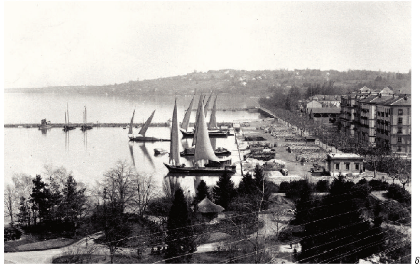
Fig. 6 : Le port des Eaux-Vives, vers 1880

cours était jusque-là centré sur les questions d'exploitation, entreprennent d'élargir leur argumentation sur les atouts que représenterait une telle infrastructure pour l'agrément et le tourisme. Dirigé par des radicaux dissidents, le journal La Démocratie publie ainsi le 10 avril 1856 un article sur le projet « grandiose » qui consisterait à « transformer toute la surface du lac, entre les bains Lullin, les Pâquis et la ville, en un immense port ou rade », dans lequel « se trouveraient sûrement abritées toutes les embarcations, quelle que soit leur nature ». Le plan d'eau serait par ailleurs doté d'une île artificielle établie à l'arrière de la passe d'entrée, qui « embellirait la vue du lac sans la masquer et offrirait un charmant but de promenade pour les embarcations ». L'information est reprise quatre jours plus tard par le Journal de Genève .