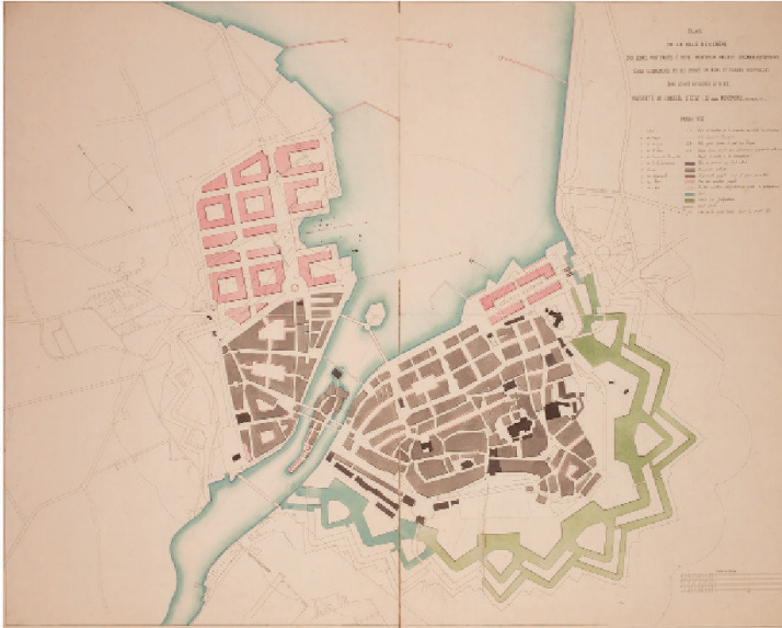
Fig. 3 : « Projet général de port », par Alexandre Rochat-Maury, 5 novembre 1854