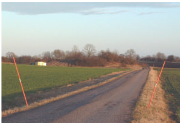
Gullbergshögen, numera nästan helt igenväxt. Foto Länsstyrelsen. 2001.

Enligt uppgift ska ett 60-tal vretabor ha begravts i kullen när pesten florerade vid 1710 års svåra pest.