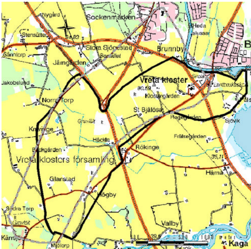
Svart heldragen linje visar den reviderade gränsen. Streckad grå linje är den äldre gränsdragningen. Ur GSD-Ekonomiska kartan diarienummer 507-97-884.

De föreslagna gränserna motiveras framför allt av järnålderns bebyggelseenheter och upplevelsen av landskapet. Utsikten från gravfälten, mot de gamla bylägena och gravfälten på höjderna runt omkring ger en uppfattning om hur landskapet nyttjades från förhistorisk tid och fram till tiden för laga skifte på 1800-talet. Slutligen har Vreta klostrets kyrkskola från 1911 tagits med i riksintresset, med motiveringen att skolan utgör en av flera viktiga institutioner i det sockencentrum som Vreta kloster en gång utgjorde.