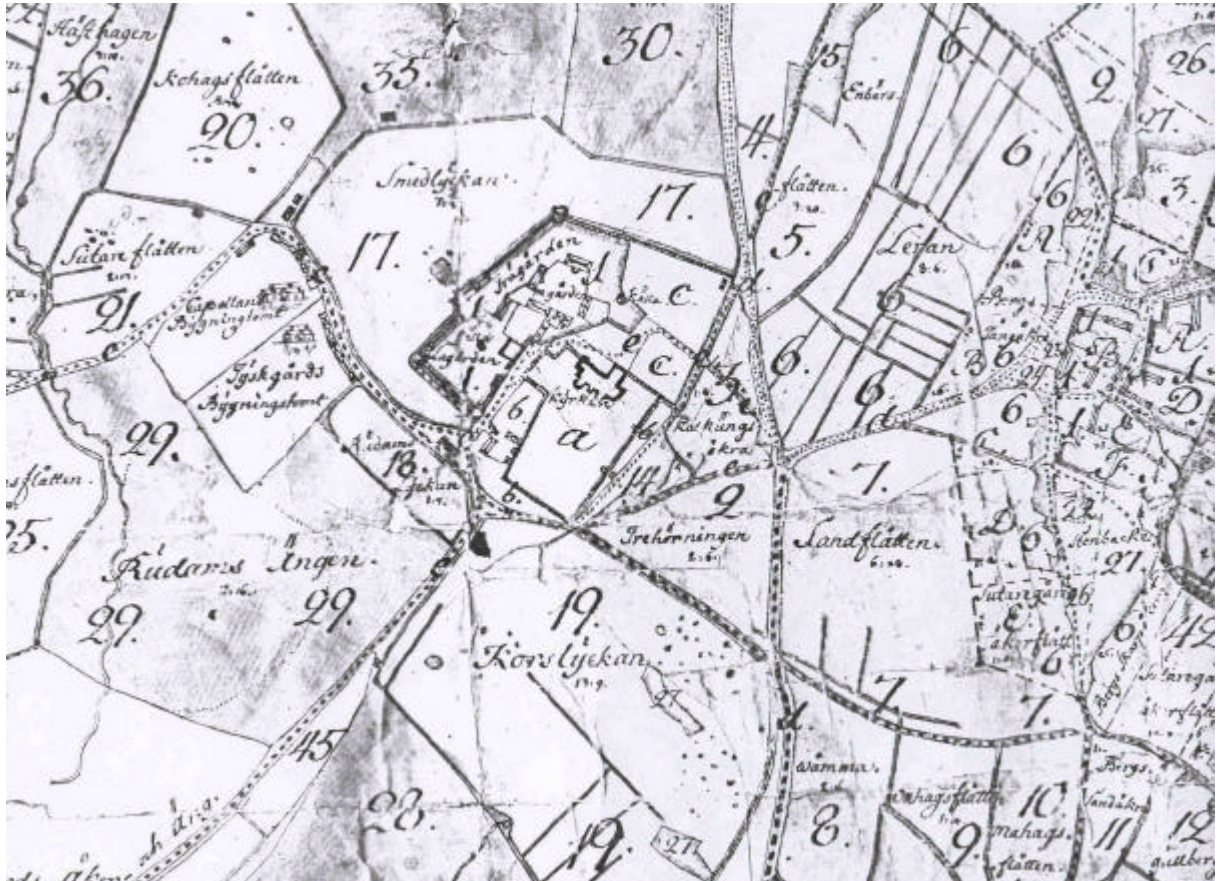
Utdrag ur "Concept charta öfver Bergs By med Prästegården uti Wreta kloster sochn och Gullbergs härad 1773-1774. Lantmäteriet i Linköping, akt nr 45. Bergs By syns i kartan öster om Wreta kloster, där idag Lantbrukskolans byggnader ligger.