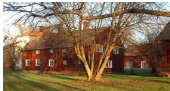
De båda flyglarna är uppförda på 1600-talet. I förgrunden det s k "biskopsloftet".