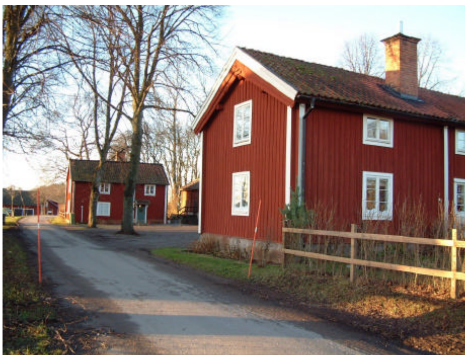
I förgrunden fattigstugan i Vreta kloster by. På andra sidan gårdsplanen ligger klockaregården med sockenstuga. 2001.

Vreta klostrets kyrkby har varit ett viktigt sockencentrum, vilket också byggnader i byn visar. Strax söder om kyrkogården ligger två rödfärgade timmerhus - fattigstugan och den gamla klockaregården med sockenstuga. Byggnaderna är enligt uppgift uppförda på 1780-talet. Redan på 1600-talet finns det dock uppgifter om en sockenstuga och ett tingshus i byn. I detta sammanhang kan också nämnas att den s k kyrkboden på kyrkogården fungerade som sockenmagasin från år 1799 fram till 1862. Därefter förvarades i boden enbart det spannmål som inköptes för fattigvårdens behov.