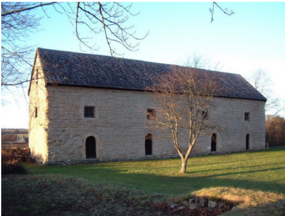
Den enda bevarade byggnaden från klostertiden. 2001.

Utanför det egentliga klosterområdet finns en större stenbyggnad, uppförd under 1200-talets andra hälft. Här inryms sedan 1920-talet ett museum med fynd från utgrävningarna. Byggnadens ursprungliga funktion är inte känd, men den kan ha fungerat som magasin för klostrets värdefullaste tillgång - spannmål.