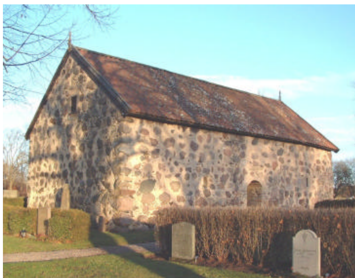
Medeltida byggnad ("kyrkbod") strax söder om kyrkan. Foto Lst. 2001.

Söder om kyrkan ligger en bod av gråsten som troligen tillkom vid medeltidens slut. Byggnaden har tidigare varit kyrkobod och på 1800-talet var sockenmagasinet inrymt i boden. Idag används byggnaden som bisättningsrum.