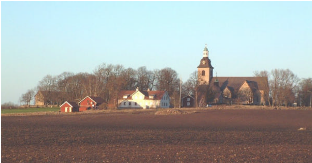
Byn Vreta kloster. I förgrunden f d kommunalhus- och ålderdomshemmet Vretagården. Foto från söder. Länsstyrelsen, 2001.

Av 1700-talets storskifteskarta över Vreta kloster framgår att byn hade tre gårdar - Biskopsgården i kyrkans ägo, komministerbostället Sutaregården och Haggården (även kallad Tyskgården). De sistnämnda gårdarna låg före laga skiftet sydväst om kyrkan, medan Biskopsgården låg och alltså ligger alldeles väster om kyrkans bogårdsmur. Vid laga skiftet år 1845 flyttades komministerbostället Sutaregården till Ekbacken väster om kyrkan. Haggården flyttade ett stycke söderut, strax utanför riksintressets gräns i sydost.