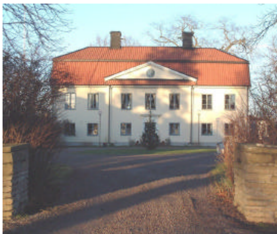
Biskopsgårdens manbyggnad från 1700-talet. 2001.