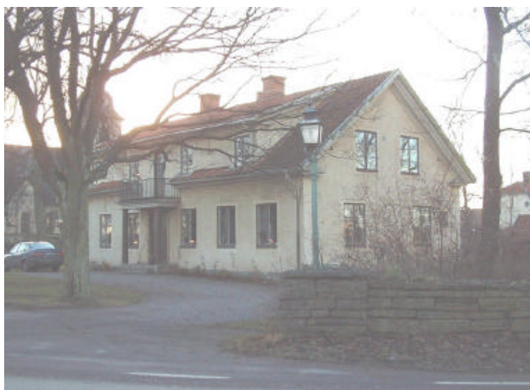
Klockaregården från år 1864 ligger mitt emot Kyrkskolan.

Nordost om kyrkan, på andra sidan vägen mot Blåsvädet ligger kyrkskolan, byggd år 1911, med tillbyggnad från år 1952 och lärarbostad från slutet av 1940-talet. Mitt emot skolan ligger Klockaregården, ett reveterat trähus uppfört år 1864. Byggnaden har fungerat som klockarebostad, småskola, lärarbostad samt bostad för kantorn.