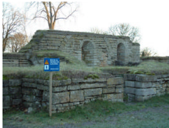
Ruiner efter klostret i Vreta. 2001.

Klostret överlevde reformationen och upplöstes inte förrän de sista nunnorna dog på 1580-talet. Ruinerna efter de nedrasade och rivna byggnaderna ligger kvar norr om kyrkan. Området undersöktes i samband med renoveringen av kyrkan, och ytterligare några år på 1920-talet.