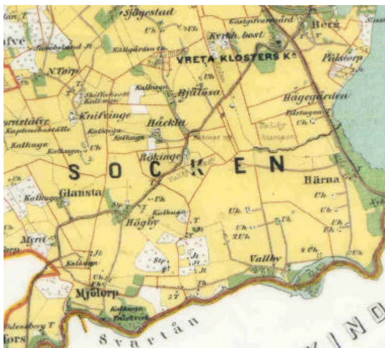
Utsnitt ur häradskartan, Gullbergs härad. År 1878.

Vägnätet i området har kraftigt förändrats. Nya vägar har tillkommit och många av de äldre har lagts igen och blivit åkermark. En av de äldre vägarna i området är den mellan Ledberg och Vreta kloster, som återfinns på 1700-talets storskifteskartor. Genom riksintresset går motortrafikleden mellan Linköping och Motala. Vägen är till stora delar anlagd på den gamla järnvägssträckningen norrut från Linköping mot Fornåsa/Motala. Vid motortrafikleden, strax norr om riksintresset, ligger fortfarande Vreta kloster järnvägsstation. I öster, mestadels utanför riksintresset, går gamla landsvägen mellan Linköping och Vreta kloster.