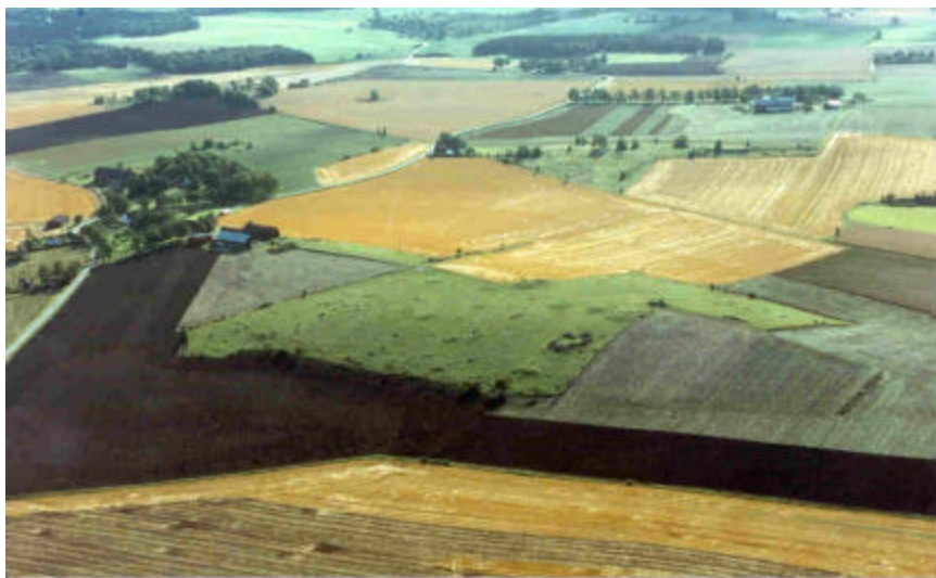
Gravfälten ligger som öar i den annars uppodlade slättbygden (fornlämning 18, vid Högby). Foto mot SV, Jan Norrman, Riksantikvarieämbetet. 1991.

Merparten av fornlämningarna härrör från järnåldern. De många gravfälten från denna tid visar på ett pedagogiskt sätt järnålderslandskapets struktur. Monumentalt på höjderna i landskapet ligger gravfälten med sina stensättningar och högar. På sluttningarna nedanför gravkullarna ligger de historiska byarna i området. På samma platser låg förmodligen också de förkristna boplatserna. Därmed ser vi i Vreta kloster ett landskap med kontinuitet från åtminstone yngre järnålder. Detta landskap fanns till stora delar kvar fram till laga skifte på 1800-talet.