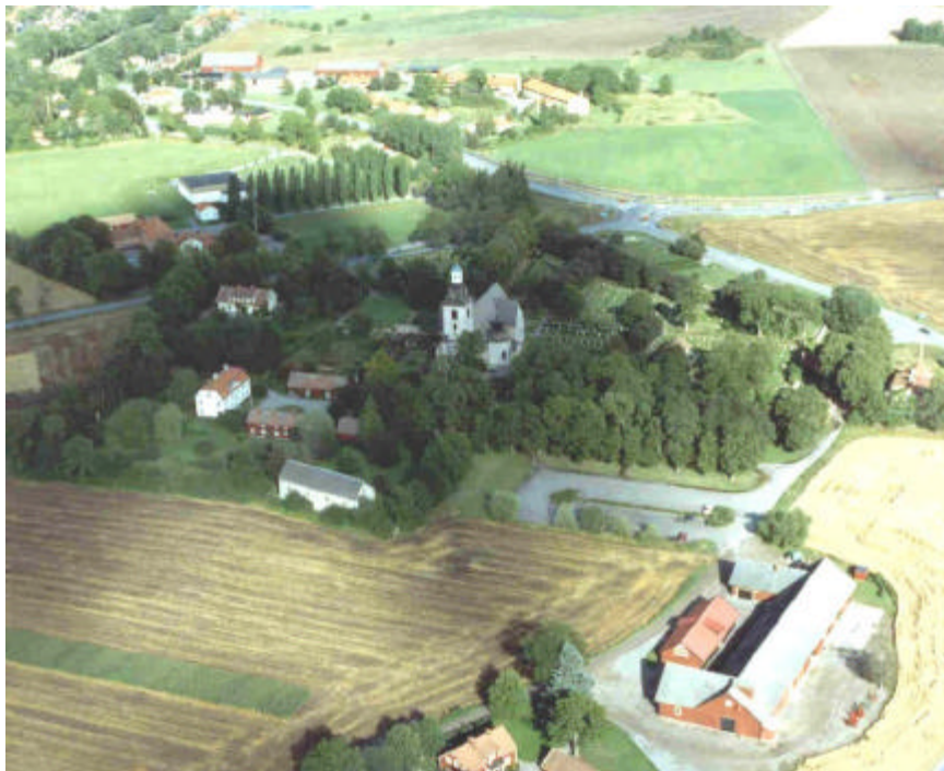
Flygbild över Vreta kloster, mot ONO. 1991.

I riksintressets norra del reser sig Vreta klostrets kyrka, vida synlig över slätten mot Linköping. Kyrkan, liksom klostret, uppfördes på initiativ av den stenkilska kungaätten i början av 1100-talet. Läget visar tydligt den makt och prestige kyrkobyggnaden innebar.