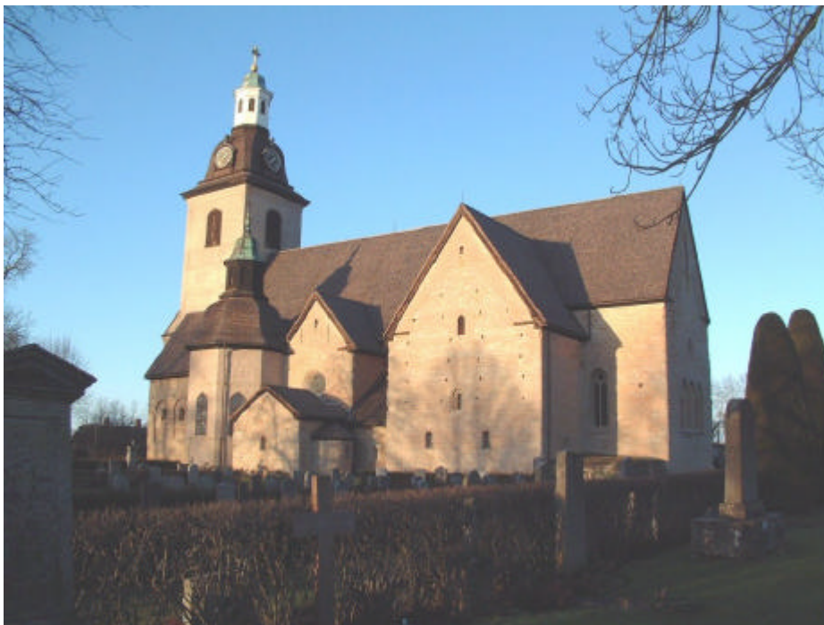
Kyrkan i Vreta kloster. 2001.

Som ett led i hela klosteranläggningens utbyggnad, tillbyggdes under 1100-talets senare del det stora, korsformiga koret, ”nunnekoret”. Hela kyrkan fick då en plan i överensstämmelse med det cistercienska byggnadsskicket, där lekmän respektive vigda disponerade olika, från varandra avskilda delar av kyrkan. Det tillbyggda koret utgjorde nunnornas del av kyrkan. Klosterkyrkan har alltså under hela medeltiden använts som sockenkyrka.