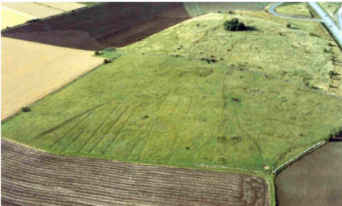
Gravar och fossil åkermark, fornlämning 14 vid Håckla. Foto mot NNV. 1991.

Intill väg 36, vid Knivinge ungefär mitt i riksintresset, finns områdets mest kända lämningar av fossil åkermark (fornlämning 14). På krönet av en drumlin har ett stort gravfält anlagts under loppet av järnåldern. Gravfältet består av 195 runda stensättningar, 9 högar och 3 kvadratiska stensättningar. Runtom gravfältet, men främst i söder och öster, ligger de förhistoriska åkertegarna. De utgörs av parcellåkrar med diken, åkerhak, terrasseringar, övermossade stensträngar och mindre, oregelbundna stenanhopningar från odling och röjning.