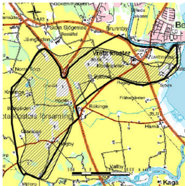
Skrafferad yta visar riksintresse för naturvården NE 51 Vreta kloster: Ur GSD-Ekonomiska kartan diarienummer 507-97-884.

Området sammanfaller i stora delar med riksintresse NE51 för naturvården. Det är ansamlingen av drumliner, de stäppartade torrängarna och det geologiskt intressanta skifferbrottet vid Knivinge som gör området till en mycket värdefull och skyddsvärd naturmiljö.