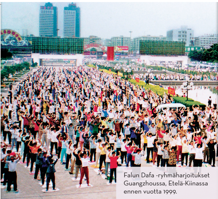
Falun Dafa -ryhmäharjoitukset Guangzhoussa, Etelä-Kiinassa ennen vuotta 1999.